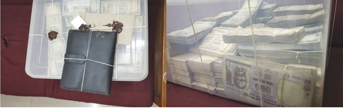
ગઈકાલે પેથાપુર ચાર રસ્તા પાસે નાસતા ફરતા આરોપીઓને પકડવા વાહન ચેકિંગ કરી રહી હતી ત્યારે મહુડી તરફથી આવતી એક સફેદ કલરની શેવરોલેટ

જૂની રૂ. ૧૦૦૦ અને ૫૦૦ના દરની ચલણી નોટના બંડલો મળી આવ્યા હતા. કારમાં રૂ. ૧૦૦૦ના દરની રૂ. ૩૧.૫૮