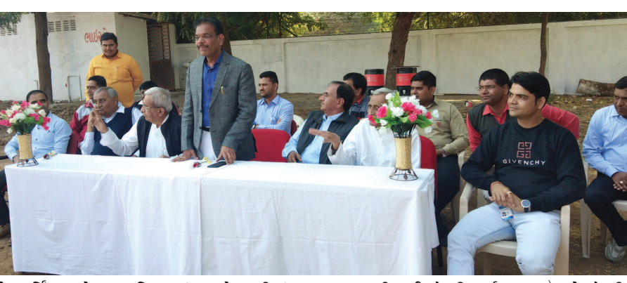
શ્રી અખિલ આંજણા કેળવણી મંડળ સંચાલિત યૌધરી ઈન્સ્ટીટ્યુટ ઓફ નર્સિંગ ખાતે રમતગમત દિવસની ઉજવણી કરવામાં આવી હતી.