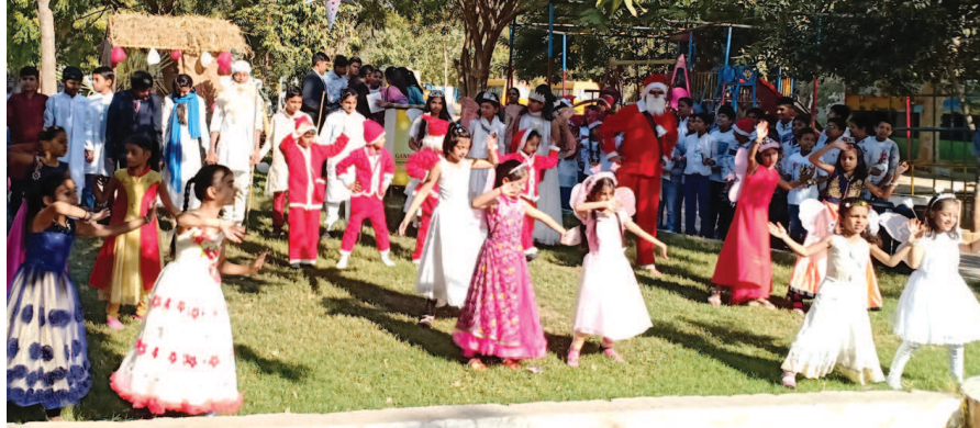
ગાંધીનગર ઈન્ટરનેશનલ પબ્લીક સ્કૂલમાં શનિવારે 'ક્રીસમસ ડે'ની ઉજવણી કરવામાં આવી હતી. આ પ્રસંગે નાતાલનું શું મહત્વ છે? અને શા માટે મનાવવામાં આવે છે, તે બાબતે વિદ્યાર્થીઓને માહિતીગર કરવામાં આવ્યા હતા. વિદ્યાર્થીઓ દ્વારા 'ક્રીસમસ ડે'ની ઉજવણીના ભાગરૂપે નાટક રજૂ કરવામાં આવ્યું હતું અને શાળાના પ્રિન્સીપાલે વિદ્યાર્થીઓને 'ક્રીસમસ ડે'ની શુભેચ્છાઓ પાઠવી હતી.