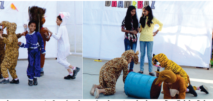
સ્કૂલ ઓફ અચિવર, કુડાસણ દ્વારા 'અચિવરસ બેસ્ટ ડ્રામેબાઝ' કાર્યક્રમનું આયોજન કરવામાં આવ્યું હતું. ઉદ્ઘોષણથી માંડીને તમામ વ્યવસ્થામાં બાળકોએ મહત્વની ભૂમિકા અદા કરી હતી. ધોરણ-૧ થી ૮ના વિદ્યાર્થીઓ