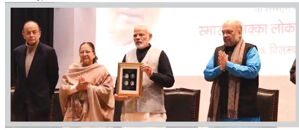
બિહારી વાજપેયીના સન્માનમાં પ્રધાનમંત્રી નરેન્દ્ર મોદીએ ૧૦૦ રૂપિયાનો સ્મારક સિક્કો લોન્ચ કર્યો

ન્યુ દિલ્હી, તા. ૨૪ ઉલ્લેખનીય છે કે, અટલ બિહારી વાજપેયીનો જન્મ ૨૫ ડિસેમ્બર ૧૯૨૪ના રોજ ગ્વાલિયરમાં થયો હતો. એવામાં સરકાર તેમની ૯૫મી જન્મજયંતીને ખાસ બનાવી છે. અટલજીનો સિક્કો જાહેર કરતાં પીએમ મોદીએ કહ્યું કે, અટલજીનો સિક્કો આપણા દિલો પર ૫૦ વર્ષો સુધી ચાલ્યો. જો આપણે તેમના આદર્શો પર ચાલીશું તો આપણે પણ અટલ બની શકીએ છીએ. આપણે તેમના જીવન પરથી પ્રેરણા લેવી જોઈએ.