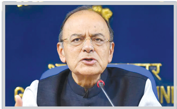
પ્રાથમિકતા સિમેન્ટ ઉપર ટેક્સ ઓછા કરવાના છે. બીજા મોટી ટકામાં ટ્રાન્સફર થઈ ચુક્યા છે.

ઓટો પાર્ટ્સ હવે ૨૮ ટકાના સ્લેબમાં રહ્યા છે. અમારી આગામી બિલ્ડિંગ મટિરિયલ્સ પહેલાથી જ ૨૮થી ૧૮ ટકા અથવા તો ૧૨