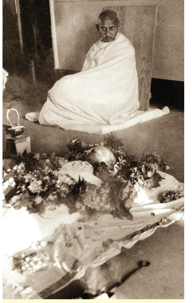
સોજન્ય : કુતલ નિમાવત સંપાદિત પુસ્તક 'ગાંધીકથા' કથાકાર : સ્વ. શ્રી નારાયણ દેસાઈ

ઉતાવળ હતી એને પ્રાર્થના માટે જવા માટે. ભક્તને ઉતાવળ હતી પ્રાર્થનાભૂમિ પર પહોંચવા માટે. અને ભગવાનને ઉતાવળ હતી ભક્તને મળવાની એટલે પ્રાર્થનાભૂમિ સુધી પહોંચવા જ ન દીધા ને અડધે રસ્તે જ પડ્યા. સૂતા સૂતા પથારીમાં જવાને બદલે ચાલતા ચાલતા ગયા. એમની દૈનિક ઈચ્છામૃત્યુ જ સંપન્ન થયું. આપણી દૈનિક એ આપણને વિચાર કરતાં કરી મૂકે તો પૂરતું છે : કદી સમય મોડો નથી થતો વિચારવાનો. આજે પણ એ સમય એટલો જ રિલેવન્ટ છે.