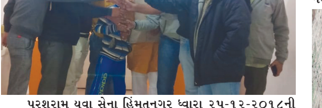
પરશુરામ યુવા સેના હિંમતનગર ધ્વારા ૨૫-૧૨-૨૦૧૮ની ઉજવણી પરશુરામ દાદાની આરટી કરીને કરવામાં આવી અને અટલજીની જયંતી પર યાદ કરી વંદન કરવામાં આવ્યું. વારાહીના બ્રહ્મસમાજ પરના હુમલાના મુદ્દે ચિંતન કરવામાં પણ આવ્યું. આવી ઘટના કરથી બ્રહ્મસમાજ માટે ના બને અને વારાહીના પરિવારને ન્યાય મળે એ બાબને ગૃહમંત્રીને આવેદન પત્ર આપવામાં આવશે.

મોડાસા ટાઉન પોલીસતંત્ર કાયદો અને વ્યવસ્થાની સ્થિતિ જાળવવામાં નિષ્ફળ રહેતા મોડાસા નગરજનોમાં ભારે આકોશ જોવા મળી રહ્યો છે. ટાઉન પોલીસે ચોર,