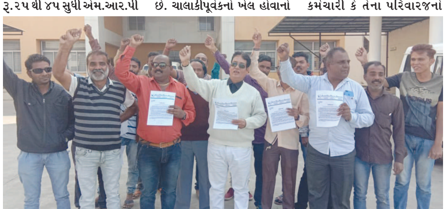
લાગુ કરવી જેનો અમલ ૨૮ ડિસેમ્બર ૨૦૧૮ના રોજ અમલમાં આવશે. ટ્રાઈના આ નિર્ણયનો અરવલ્લી કેબલ ઓપરેટર એસોસિએશન દ્વારા શખ્ત વિરોધ કરી જલ્લા અધી.કલેક્ટર વલવીને આવેદનપત્ર આપી ટ્રાઈનો નિર્ણય પાછો લેવાની માંગ કરી હતી.

મોડાસા, તા. ૨૭ ટેલિકોમ ઓથોરિટી ઓફ ઈન્ડિયાએ તા. ૧૬ નવેમ્બર ૨૦૧૮ના રોજ નિર્ણય જાહેર કર્યો છે કે પ્રત્યેક ચેનલ પર પ્રતિમાસ રૂ.૨ થી ૪૫ સુધી એમ.આર.પી સંસ્થા, સરકારી સંસ્થાઓ, એનજીઓ અને બિન રાજકીય સંસ્થાઓ સાથે ચર્ચા વિચારણા કાર્ય બાદ નિર્ણય લેવાના બદલે મનસ્વી રીતે સરમુખત્યાર નિર્ણય ઠીક ઠીકો છે. ચાલકીપૂર્વકનો ખેલ હોવાનો ઈન્ડસ્ટ્રીમાં એમ.આર.પી. નિયમના કારણે હજારો કેબલ ઓપરેટરો અને સહાયકો અર્થિક રીતે ભરબાદ થઈ જશે, જો કોઈ કેબલ ઓપરેટર કે કેબલ ઈન્ડસ્ટ્રીના કર્મચારી કે તેના પરિવારજનો