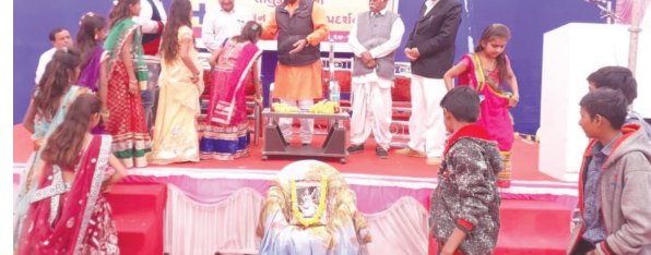
ડીસાના ભાયરવા ગામે તાલુકા કક્ષાની શિબિર યોજાઈ