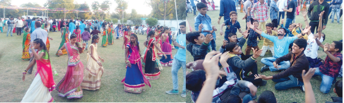
ગાંધીનગરના સેવાભાવી યુવાનોની સંસ્થા હેપ્પી ટુ હેલ્થ ફાઉન્ડેશન દ્વારા થઈ ફર્ટને અનુલક્ષી આજે 'ઉજવણી ૨૦૧૮' શિષ્યક હેઠળ શહેરની દિવ્યાંગ બાળકો માટેની શૈક્ષણિક સંસ્થાઓ ઉપરાંત આશ્રમ શાળા, સ્પેશિયલ બિલ્ડન હોમ વગેરેના બાળકો તેમજ વૃદ્ધાશ્રમના વડીલોને આનંદ કરાવવાના હેતુથી રાસ ગરબાનું આયોજન કરવામાં આવ્યું હતું. આ રાસ ગરબામાં જાણીતા ગરબા ગાયિકા સરલા દેવેએ લાઈવ ગરબા પ્રસ્તુત કર્યા હતા.

છે. માર્ગ વચાળે ટ્રાફિકમાં ફસાયેલા ક્રેટલાક વાહનચાલકોએ પોતાના વાહન માર્ગની સાઈડમાં લઈ લીધા હતા. જ્યારે ટ્રાફિક હળવો થયા બાદ ક્રેટલાક વાહન ચાલકો આગળ વધ્યા હતા. જ્યારે માર્ગ પર ટ્રાફિકજામને પગલે વાહનોની હારમાળા સર્જઈ હતી.