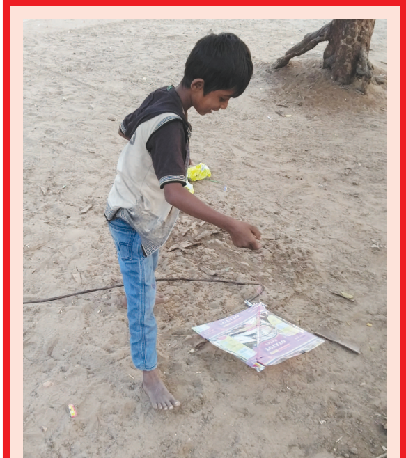
ચલી ચલી રે પતંગ મેરી ચલી રે... આવા ગીતો ગાવાના દિવસોને હજી ઘણીવાર છે પરંતુ ક્યાંક ક્યાંક પતંગ દેખાઈ જાય છે. બાળકો માટે તો પતંગ ઉડાડવા માટે કોઈ તહેવારની તો ક્યાં જરૂર પડે છે. તેમના માટે તો બારેમાસ ઉત્તરાયણ જ હોય છે. પતંગ ઉડાડવાનો પ્રયત્ન કરતું આ બાળક બાળપણની પૂરેપૂરી મજા માણી રહ્યો છે.