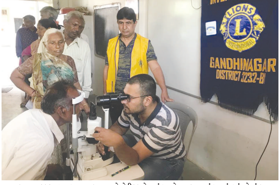
લાયન્સ કલબ દ્વારા આમજા ગામ ખાતે મેડીકલ કેમ્પનું આયોજન કરવામાં આવ્યું હતું. જેમાં ગામના ૩૦૦ જેટલા ગ્રામજનોએ આ કેમ્પનો લાભ લીધો હતો.