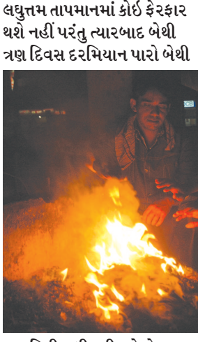
ત્રણ ડિગ્રી સુધી ઘટી શકે છે. વહેલી સવારમાં અને મોડી રાત્રે ઠંડીનો અનુભવ થઈ રહ્યો છે. મોટાભાગના લોકો મોડી રાત્રે ગરમ વસ્ત્રોમાં પણ નજરે પડવા

અમદાવાદ સહિત રાજ્યભરમાં ઠંડીના પ્રમાણમાં એકાએક તીવ્ર વધારો થઈ ગયો છે. રાજ્યના મોટાભાગના વિસ્તારોમાં લઘુત્તમ તાપમાનમાં ફરી એકવાર ઘટાડો થયો છે. નલિયામાં પારો ગગડીને ૧૫.૬ ડિગ્રી થયો છે. આવી જ રીતે ડિસામાં પણ લઘુત્તમ તાપમાન ૧૫.૬ સુધી નીચું રહ્યું છે. અમદાવાદમાં આજે સવારથી જ ઠંડીનો ચમકારો રહ્યો હતો. લઘુત્તમ તાપમાન ૧૦.૮ ડિગ્રી રહેતા લોકો દિવસ દરમિયાન પણ ગરમ વસ્ત્રોમાં દેખાયા હતા. હવામાન વિભાગના કહેવા મુજબ આવતીકાલે અમદાવાદમાં મુખ્યરીતે વાદળથી વાતાવરણ રહેશે નહીં. આગામી ૨૪ કલાકમાં