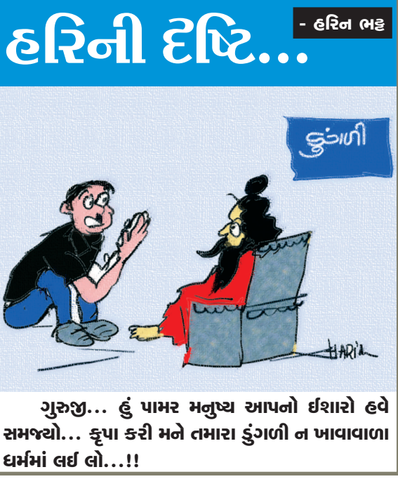
ગુરુજી... હું પામર મનુષ્ય આપનો ઈશારો હવે સમજ્યો... કૃપા કરી મને તમારા કુંડાળી ન ખાવાવાળા દર્મમાં લઈ લો...!!