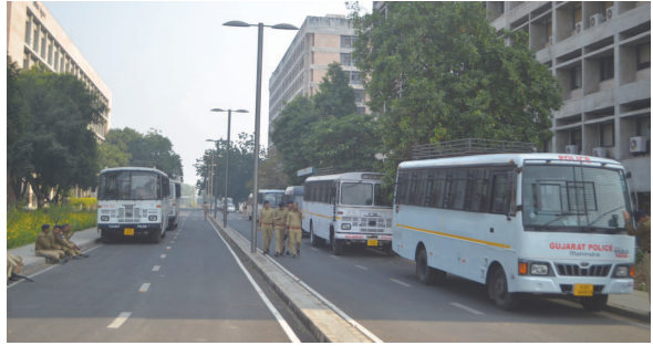
પોલીસનો લોખંડી પહેરો રહેશે. સોમવારના રોજ શહેરમાં ૬ એસપી, ૨૫

ઉચ્ચ અધિકારીઓ પણ સતત નજર રાખતા રહેશે. ત્યારે શહેરના ઘ-પ સર્કલ પાસે આવેલા ઓપનએર થિયેટર ખાતેથી સવારે ૮.૩૦ કલાકે કોંગ્રેસ વિધાનસભા ઘેરાવ કરવામાં માટે પ્રસ્થાન કરશે. કોંગ્રેસ કાર્યકરોએ પોતાના કાર્યક્રમને સફળ બનાવવા માટે એકશન પ્લાન તૈયાર કરી દીધો છે. ગાંધીનગર સહિત રાજ્યભરમાંથી કાર્યકરો મોટીસંખ્યામાં ગાંધીનગર ખાતે આવી પહોંચશે, તો બીજા તરફ કોંગ્રેસની સાથે બિન સચિવાલય રદ કરોના ઉમેદવારો અને ખેડૂત મિત્રો પણ મોટીસંખ્યામાં જોડાય તેમ લાગી રહ્યું છે.