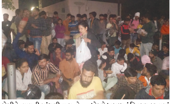
બેસીને ન્યાયની માંગણીના સુત્રો પો કારતા આ ઉમેદવારોને

મક્કમતા દર્શાવતા ઠંડીમાં પુલ્લામાં રાતવાસો કરી રહ્યાં છે. આખો દિવસ ભૂખ્યાં-તરસ્યાં ગાંધીનગરની સેવાભાવી સંસ્થા અલ્પ હુમન બીઈંગ ચેરિટેબલ ફાઉન્ડેશન દ્વારા માનવતાના ધોરણે ધાબળાનું વિતરણ કરવામાં આવ્યું હતું તેમજ ચા-નાસ્તો,