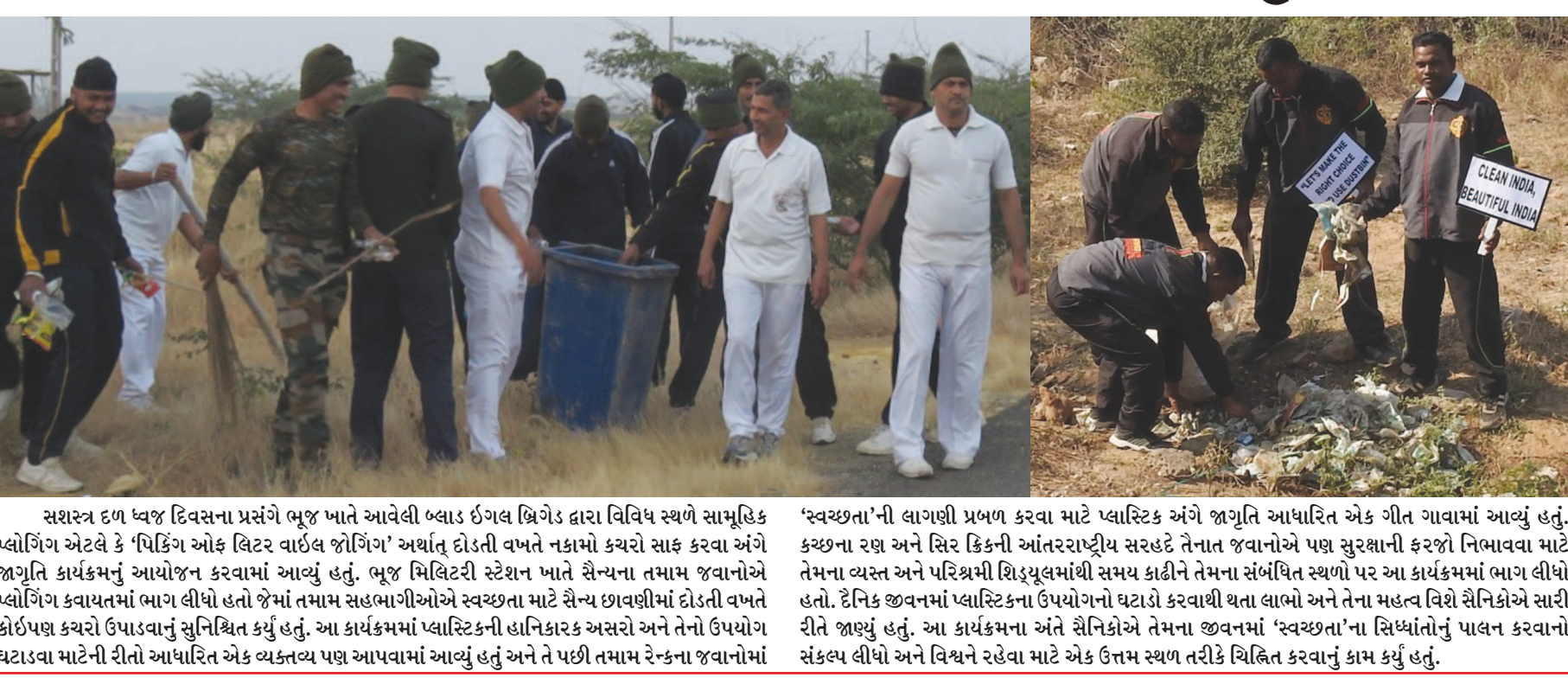
સશસ્ત્ર દળ ધ્વજ દિવસના પ્રસંગે ભૂજ ખાતે આવેલી બ્લાડ ઈંગલ બ્રિગેડ દ્વારા વિવિધ સ્થળે સામૂહિક પ્લોગિંગ એટલે કે ‘પિક્કિંગ ઓફ લિટર વાઈલ જોઈંગ’ અર્થાત્ દોડતી વખતે નકામો કચરો સાફ કરવા અંગે જાગૃતિ કાર્યક્રમનું આયોજન કરવામાં આવ્યું હતું. ભૂજ મિલિટરી સ્ટેશન ખાતે સૈન્યના તમામ જવાનોએ પ્લોગિંગ ક્વાયતમાં ભાગ લીધો હતો જેમાં તમામ સહભાગીઓએ સ્વચ્છતા માટે સૈન્ય છાવણીમાં દોડતી વખતે કોઈપણ કચરો ઉપાડવાનું સુનિશ્ચિત કર્યું હતું. આ કાર્યક્રમમાં પ્લાસ્ટિકની હાનિકારક અસરો અને તેનો ઉપયોગ ઘટાડવા માટેની રીતો આધારિત એક વ્યક્તિય પણ આપવામાં આવ્યું હતું અને તે પછી તમામ રેન્કના જવાનોમાં ‘સ્વચ્છતા’ની લાગણી પ્રબળ કરવા માટે પ્લાસ્ટિક અંગે જાગૃતિ આધારિત એક ગીત ગાવામાં આવ્યું હતું. કચ્છના રણ અને સિર કિંકની આંતરરાષ્ટ્રીય સરહદે તેનાત જવાનોએ પણ સુરક્ષાની ફરજો નિભાવવા માટે તેમના વ્યસ્ત અને પરિશ્રમી શિફ્ટમાંથી સમય કાઢીને તેમના સંબંધિત સ્થળો પર આ કાર્યક્રમમાં ભાગ લીધો હતો. દૈનિક જીવનમાં પ્લાસ્ટિકના ઉપયોગનો ઘટાડો કરવાથી થતા લાભો અને તેના મહત્વ વિશે સૈનિકોએ સારી રીતે જાણ્યું હતું. આ કાર્યક્રમના અંતે સૈનિકોએ તેમના જીવનમાં ‘સ્વચ્છતા’ના સિધ્ધાંતોનું પાલન કરવાનો સંકલ્પ લીધો અને વિશ્વને રહેવા માટે એક ઉત્તમ સ્થળ તરીકે ચિહ્નિત કરવાનું કામ કર્યું હતું.