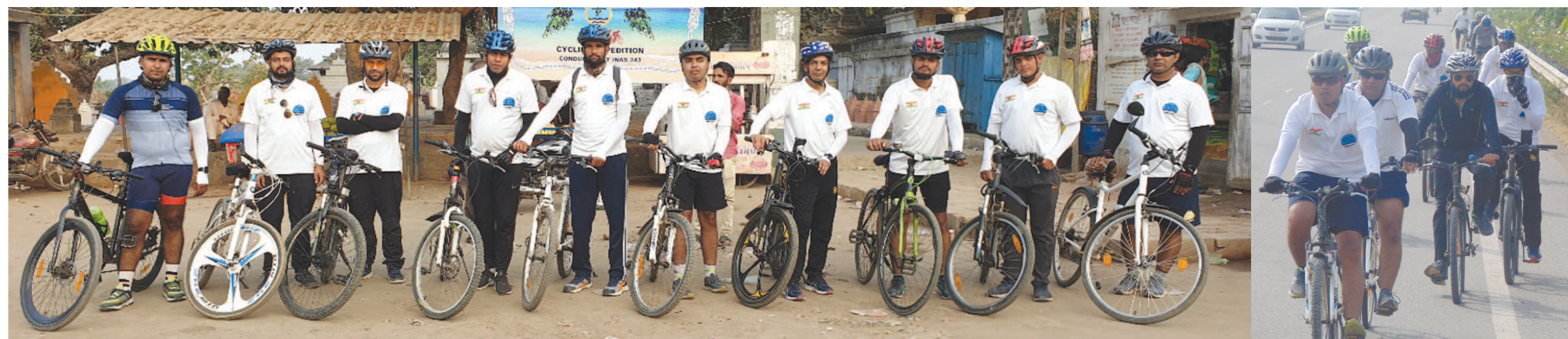
નેવી વિકની ઉજવણી નિમિત્તે આઈએનએસ દ્વારા એક સાઈકલ એક્સ્પીડિશનનું આયોજન ઓખાથી દિવ સુધી કરવામાં આવ્યું હતું. ૩ થી ૬ ડિસેમ્બર દરમિયાન યોજાયેલી આ ૩૬૪ કિમીની એક્સ્પીડિશનમાં ગુજરાત નેવલના ૧૦ જેટલા જવાનો જોડાયા હતા. કોસ્ટલ સિક્યુરિટી બાબતે લોકોમાં જાગૃતિ આણવા માટે આ એક્સ્પીડિશનનું આયોજન કરવામાં આવ્યું હતું. ૧૯૭૧ની લડાઈમાં આઈએનએસ ખુકરીના જવાનોની જીતની યાદ પણ આ એક્સ્પીડિશનના માધ્યમથી તાજ કરવામાં આવી હતી, ઉજવવામાં આવી હતી.