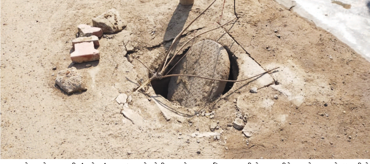
શહેરના સેક્ટર-૪-બીમાં પ્લોટ નં. ૩૮૬/૧ સામે તુટેલી ગટર ચેમ્બર આ વિસ્તારના રહીશો ખાસ કરીને બાળકો તથા વયોવૃદ્ધ વડીલો માટે જોખમી સ્થિતિમાં છે જેને સત્વરે રીપેર કરાય તેવું વસાહતીઓ ઈચ્છી રહ્યા છે.

સઘન અભ્યાસ તથા વિશ્લેષણ સાથે તૈયાર કરાયો છે. આ કાર્યક્રમ બાળકો, યુવાઓ, વડીલો તેમજ વરિષ્ઠ નાગરિકોની જાગૃતિ તથા સમજણમાં અભિવૃદ્ધિ કરવાના હેતુથી તૈયાર કરવામાં આવ્યો છે. આ કાર્યક્રમ ગાંધીનગરના આંગણે પ્રથમવાર યોજાઈ રહ્યો છે. જેમાં શહેરની જનતાને વિના મૂલ્યે જાહેર આમંત્રણ સંસ્થા દ્વારા પાઠવવામાં આવ્યું છે.