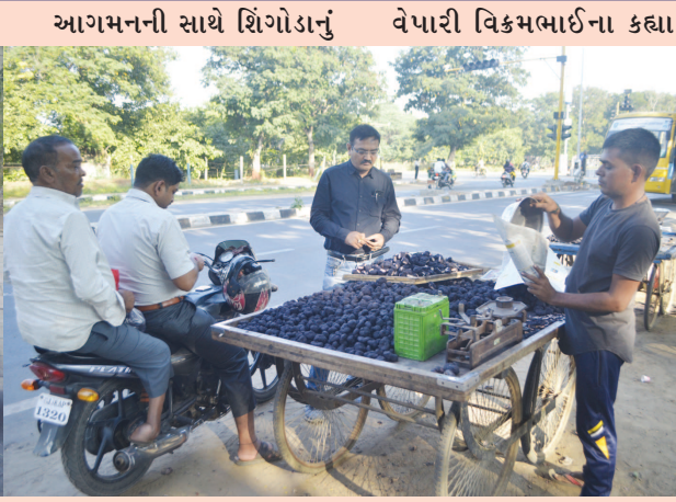
બોર દરેકના પસંદગી ધરાવતા ફળ છે. શહેરમાં શિયાળાના