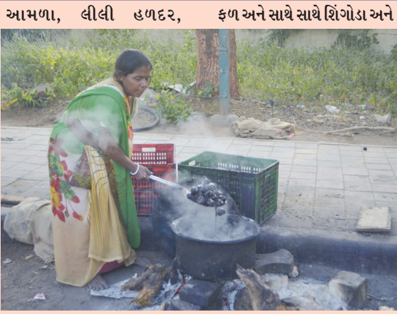
લીલીમેથી, લીલું લસણ, લીલી ડુંગળી જેવા વિટામીન આપતા

ગાંધીનગર, તા. ૧૧ શિયાળો આવતાની સાથે જ શિંગોડા શહેરમાં ઓન ડિમાન્ડ છે. શહેરમાં બાફેલા શિંગોડા ૮૦ રૂપિયે કિલો વેચાઈ રહ્યા છે. અને કાચા ૬૦ રૂપિયે કિલો વેચાઈ રહ્યા છે. શહેરમાં કાચા શિંગોડાને તૈયાર કરીને વેચતા શિંગોડાના વેપારીના કહ્યા અનુસાર દરરોજના લગભગ બે કલાક શિંગોડાનું વેચાણ તેમના દ્વારા કરાય છે.