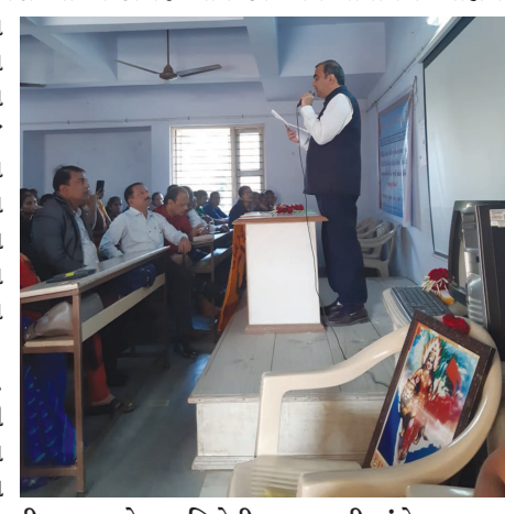
આ કાર્યક્રમમાં પાવર નિદર્શન કરાવવામાં આવ્યું પોઈન્ટ પ્રેઝન્ટેશન દ્વારા હતું.