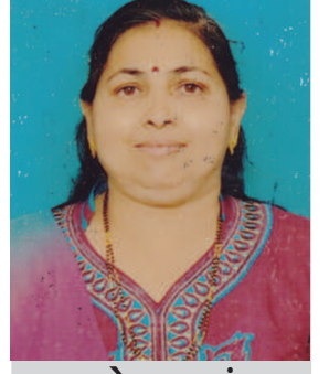
ધાયાબેન વાઘ વંડ્યા વહીવટી અધિકારી તળીની વિભાગ