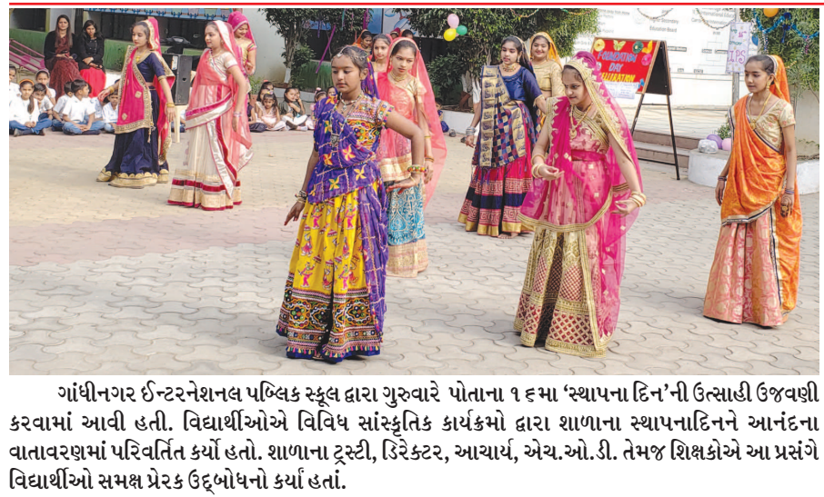
ગાંધીનગર ઈન્ટરનેશનલ પબ્લિક સ્કૂલ દ્વારા ગુરુવારે પોતાના ૧૬મા 'સ્થાપના દિન'ની ઉત્સાહી ઉજવણી કરવામાં આવી હતી. વિદ્યાર્થીઓએ વિવિધ સાંસ્કૃતિક કાર્યક્રમો દ્વારા શાળાના સ્થાપનાદિને આનંદના વાતાવરણમાં પરિવર્તિત કર્યાં હતાં. શાળાના ટ્રસ્ટી, ડિરેક્ટર, આચાર્ય, એચ.ઓ.ડી. તેમજ શિક્ષકોએ આ પ્રસંગે વિદ્યાર્થીઓ સમક્ષ પ્રેરક ઉદ્બોધનો કર્યાં હતાં.

જન્મદિને વધામણી વિભાગ અંતર્ગત કોઈપણ વાચક પોતાની તસવીરો પ્રકાશન માટે મોકલી શકે છે. પરંતુ, વાચકોને ધ્યાનમાં લેવામાં મોકલી આપવામાં આવેલ તસવીરો જન્મદિવસ હોય તેના અગાઉના દિવસે એક વાગ્યા સુધીમાં અખબારને મળી જાય. વાચકો ઈચ્છે તો આ વિભાગમાં પ્રકાશન હેતુ પોતાની તસવીરો અગાઉથી પણ મોકલાવી શકે છે. - સંપાદક