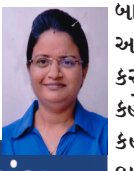
રંગ-ઉમંગ કાનલ ઓગ્રા

જેવા વર્તનની અપેક્ષા રાખે છે. આમ ન કર પેલું ન કર. દિવસ દરમિયાન તમે બાળક સાથે કરેલા વર્તનની નોંધ કરજો. બાળકને તમે કેટલીવાર કોઈ બાબત નહીં કરવા માટેની સૂચના આપી છે તે ગણજો. સાથે તે પણ ગણતરી કરજો કે એવી કેટલી બાબત છે કે કરવા માટે કહ્યું છે નહીં કરવા માટેની બાબતોની ગણતરી વધી જશે. આમ આપણે બધાં શું નહીં કરવું જોઈએ, પણ શું કરવું તે કહેતા નથી અને હા... આપણે કહીએ ત્યારની આપણી ભાષા, ઉત્તેજનાનો વણ વિચાર કરજો બાળક ઉદે ત્યારથી તે સૂવે ત્યાં સુધી આપણે તેના પર કેટલા દબાણ લાવીએ છીએ. દૂધ પીવું કે બોવિંદા, શું નાસ્તો કરવો, વાંચવા ક્યારે બેસવું, શું વાંચવું, કેટલું વાંચવું ક્યારે સુઈ જવું, ક્યાં રૂમમાં સુઈ જવું, શું ખાવું ક્યાં નાસ્તો લઈ જવું, શું રમવું, ક્યા રમવા જવું, ક્યારે દોડવું જોઈએ. ક્યારે કુદવું જોઈએ, પછી જવાબ, વાગશે વગેરે વગેરે.... જેને કરવાનું છે તેની પસંદગીનો આપણે વિચાર કરીએ છીએ અંતરમાં પચી બસ આપણી જ પસંદગી અને નાપસંદગી પ્રમાણે આપણે વર્તન કરવા પ્રેરીએ છીએ. પાંચ મિનિટ ફાળવીને તમારા