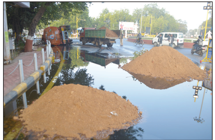
જોખમી હોવાનું અનેકવાર ધ્યાને આવ્યું છે સર્કલ પર મોડી રાત્રે તેમજ વહેલી પરાંહે વારંવાર વાહનો પલ્ટી મારવાના બનાવો અકસ્માત સર્જાયો હતો. ચ-૩ સર્કલ વિસ્તારમાં માર્ગ પર દિવેલ રેલાતા પસાર થતા વાહનચાલકો પર માર્ગ અકસ્માતનો ખતરો

મંડરાયો હતો. ગાંધીનગરના ડેપ્યુટી મેયર નાજાભાઈ ઘાંઘરને ઘટના અંગે જાણ થતા તેમણે તાત્કાલિક આ વિસ્તારમાં જે સી