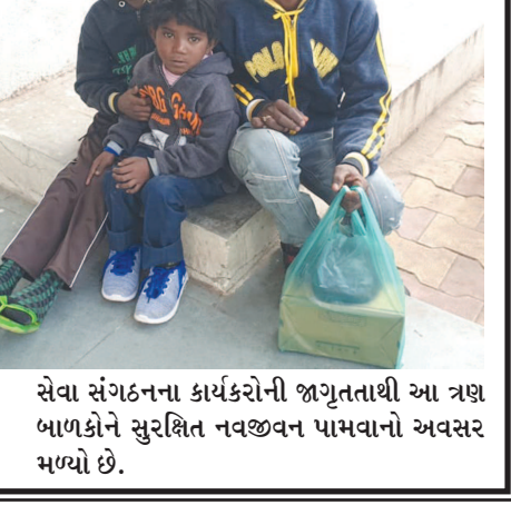
જાતિ સમુદાયમાં અભ્યાસ અને પાલનપોષણ અર્થે મોકલી આપવાનો નિર્ણય લેવામાં આવ્યો હતો.