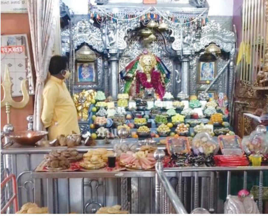
ગાંધીનગર પાસે અને સાબરમતી નદીના સાંનિધ્યમાં આવેલ જક્ષણી માતાજી- સાદરા ખાતે દેવ દિવાળી નિમિત્તે મુંદર શણગાર કરાવ્યો હતો અને અત્તકૂટ ધરાવવામાં આવ્યો હતો.

જીટીયુ દ્વારા ડીપ્લોમાં તથા ડિગ્રીની વિન્ટર-૨૦ ની પરીક્ષા ઓફ લાઈન લેવાનો નિર્ણય કરેલ છે અને લગભગ તા. ૧૦-૧૨-૨૦ પછી આ પરીક્ષાનું આયોજન કરવાનું નક્કી કરેલ છે. પરંતુ હાલમાં કોરોનાની મહામારીમાં જ્યારે ગુજરાતમાં દિવસે ને દિવસે કેસ વધતા જાય છે ત્યારે ટેકનીકલ સંસ્થાઓના પ્રતિનિધિઓ તથા વિવિધ સંસ્થામાં અભ્યાસ કરતા વિદ્યાર્થી તથા તેમના વાલીઓ જીટીયુ દ્વારા લેવાનાર ઓફલાઈન પરીક્ષાને લઈને ખુબજ ચિંતિત છે. સામાન્ય સંજોગોમાં ૧ મહિનાથી વધારે સમય ચાલતી પરીક્ષા લગભગ કોરોનાની ગાઈડલાઈન મુજબ લગભગ ૨ મહિના જેટલો સમય ચાલશે તે નક્કી જ છે. આવા સંજોગોને લીધે વાલીઓ પોતાના બાળકોને સંસ્થા ખાતે