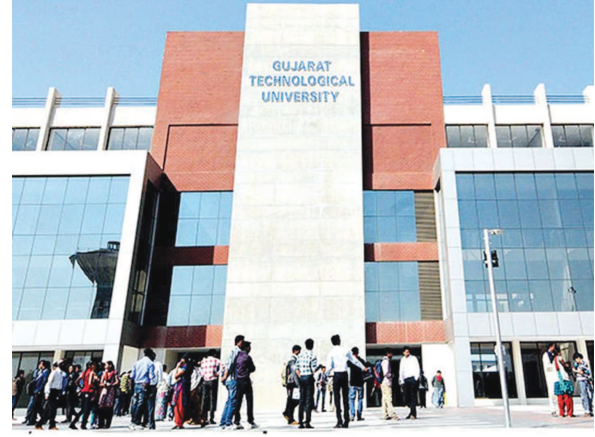
હાલમાં જીટીયુ દ્વારા વિદ્યાર્થીઓને પોતાના ઘર પાસેની ટેકનીકલ કોલેજમાં પરીક્ષા આપવાની છુટ આપવામાં આવેલ છે. પરંતુ ઘણા વિદ્યાર્થીઓની ઘરની આસપાસ લગભગ ૧૦૦ કિલોમીટર સુધી કોઈ ટેકનીકલ સંસ્થા નથી. વળી કેન્દ્ર સરકારની

કેવી રીતે મોકલશે અને સંસ્થા ૨ મહિના સુધી આ પરીક્ષા લેશે તે પણ એક મોટો સવાલ છે. જેના કિલોમીટર સુધી કોઈ ટેકનીકલ લીધે વાલીમાં ઉગ્ર આકોશ છે. સંસ્થા નથી. વળી કેન્દ્ર સરકારની