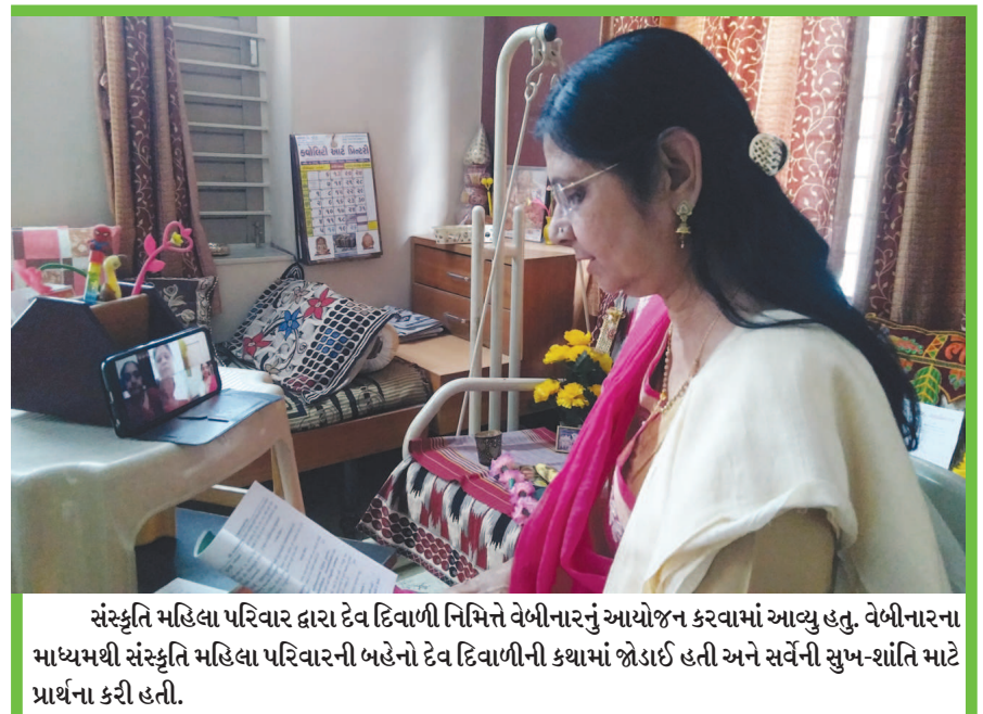
સંસ્કૃતિ મહિલા પરિવાર દ્વારા દેવ દિવાળી નિમિત્તે વેબીનારનું આયોજન કરવામાં આવ્યું હતું. વેબીનારના માધ્યમથી સંસ્કૃતિ મહિલા પરિવારની બહેનો દેવ દિવાળીની કથાઓ જોઈ શકે છે અને સર્વેની સુખ-શાંતિ માટે પ્રાર્થના કરી શકે છે.

તાજેતરમાં ૨૬ નવેમ્બરના, ૨૦૨૦ ના રોજ MIPLVP ઈન્સ્ટિટ્યુટ ઓફ સોશિઅલ વર્ક સંસ્થા દ્વારા બ્રીથ સેફ કેમ્પેન અંતર્ગત N-95 માસ્કનું DCP ઓફીસ અને પોલીસ કન્સ્ટેબલ રૂમ, અમદાવાદમાં કરવામાં આવ્યું અને આ કોવીડ-૧૯ માં પોલીસ વિભાગનો અવિરત કામ કરવા બદલ પણ તેમનો અભાર માનવામાં આવ્યો. નજીકના સમયગાળામાં આ સંસ્થા દ્વારા બીજા વિભાગો જેમકે આરોગ્ય, શિક્ષણ અને મ્યુનિસિપાલિટી વિભાગમાં કરવામાં આવશે.