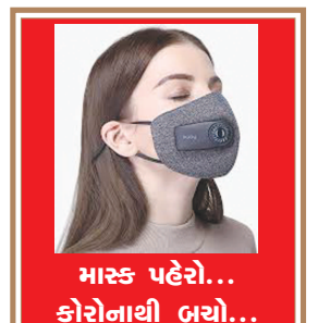
માસ્ક પહેરો... કોરોનાથી બચો...

જન્મદિને વધામણી વિભાગ અંતર્ગત કોઈપણ વાચક પોતાની તસવીરો પ્રકાશન માટે મોકલી શકે છે. પરંતુ, વાચકોને વિનંતી છે કે મોડામાં મોકી આ તસવીરો જન્મદિવસ હોય તેના અગાઉના દિવસે એક વાગ્યા સુધીમાં અખબારને મળી જાય. વાચકો ઈચ્છે તો આ વિભાગમાં પ્રકાશન હેતુ પોતાની તસવીરો અગાઉથી પણ મોકલાવી શકે છે. - સંપાદક