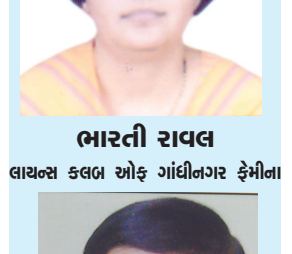
ભારતી રાવલ લાચલ કલબ ઓફ ગાંધીનગર ફેમીના