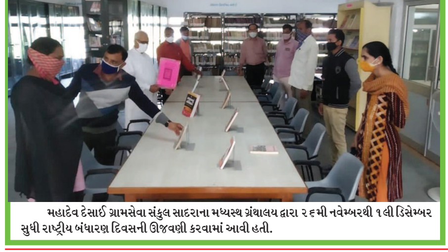
મહાદેવ દેસાઈ ગ્રામસેવા સંકુલ સાદરાના મધ્યસ્થ ગ્રંથાલય દ્વારા ૨૬મી નવેમ્બરથી ૧લી ડિસેમ્બર સુધી રાષ્ટ્રીય બંધારણ દિવસની ઊજવણી કરવામાં આવી હતી.