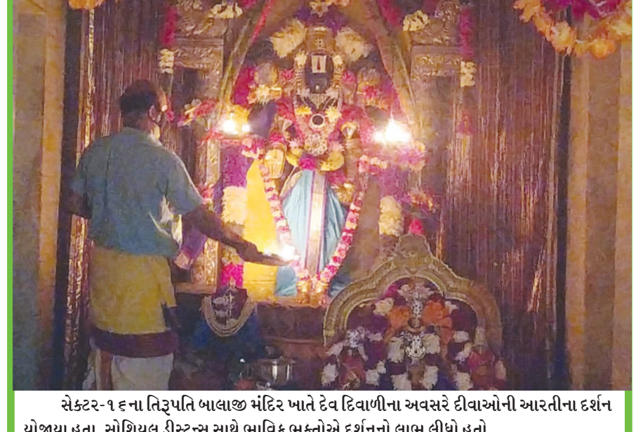
સેક્ટર-૧૬ના તિરૂપતિ બાલાજી મંદિર ખાતે દેવ દિવાળીના અવસરે દીવાઓની આરતીના દર્શન યોજાયા હતા. સોશિયલ ડિસ્ટન્સ સાથે ભાવિક ભક્તોએ દર્શનનો લાભ લીધો હતો.