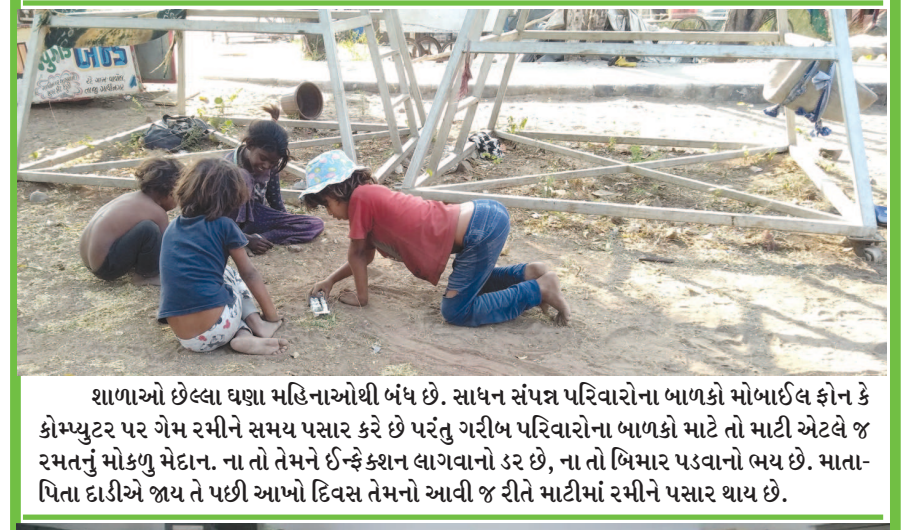
શાળાઓ છેલ્લા ઘણા મહિનાઓથી બંધ છે. સાધન સંપત્ર પરિવારોના બાળકો મોબાઈલ ફોન કે ક્રોમ્યુટર પર ગેમ રમીને સમય પસાર કરે છે પરંતુ ગરીબ પરિવારોના બાળકો માટે તો માટી એટલે જ રમતનું મોકળુ મેદાન. ના તો તેમને ઈન્ફેક્શન લાગવાનો ડર છે, ના તો બિમાર પડવાનો ભય છે. માતા-પિતા દાડીએ જાય તે પછી આખો દિવસ તેમનો આવી જ રીતે માટીમાં રમીને પસાર થાય છે.