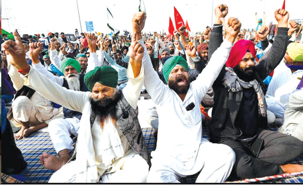
અસર જોવા મળી છે. કેટલાક સ્થળોએ ટ્રાફિક ખોરવાયો હતો તો