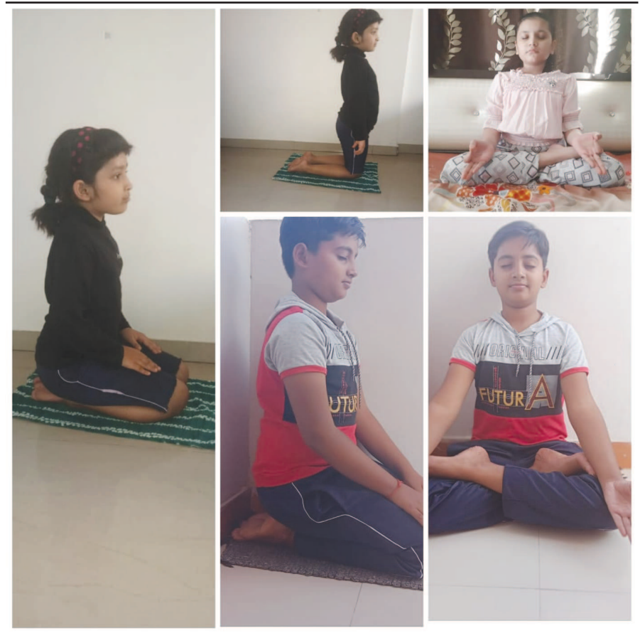
એસ.એસ.વી કેમ્પસમાં સ્કુલના વિદ્યાર્થીઓએ ઓનલાઈન યોગા કરી કોવિડ -૧૯ થી બચવા પોતાની રોગપ્રતિકારક શક્તિ વધારવા માટે યોગા અંગે માગદર્શન આપતા વીડ્યો બનાવી અન્ય વિદ્યાર્થીને યોગા અંગે પ્રોત્સાહન આપ્યું.