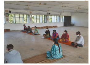
ગુજરાત વિદ્યાપીઠ સાદરા -મહાદેવ ગ્રામસેવા સંકુલ -સાદરાના બીએ, એમએ, વિભાગ દ્વારા પ્રત્યેક વિભાગોને વારંવાર જીવાણુમુક્ત કરવા માટે દવા છંટકાવ કરવામાં આવી રહ્યો છે. માસ્ક પહેરી કામ કરવામાં આવી રહ્યું છે. છ ફૂટ દૂર રહી કામકાજની આપલે કરવામાં આવી રહી છે. ઓ નલાઈન શિક્ષણ કાર્ય સૌ અધ્યાપકોના