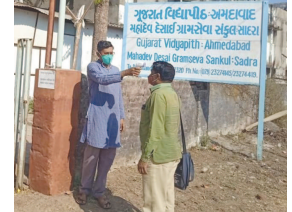
એ કોરોના મુકત રહેવા માટે માત્રને માત્ર સાવધાની એજ રસી છે માટે સાવધાન બનવાની જરૂર છે. સાવધાની ઘટી દૂર ઘટના ઘટી. દૂર ઘટના ના ઘટે માટે સાવધાનીની જરૂર છે.

ચિલોડા, તા. ૮ કોવિડ-૧૯ સંક્રમણ સામે રસી આવે ત્યાં સુધી જનસમુદાય