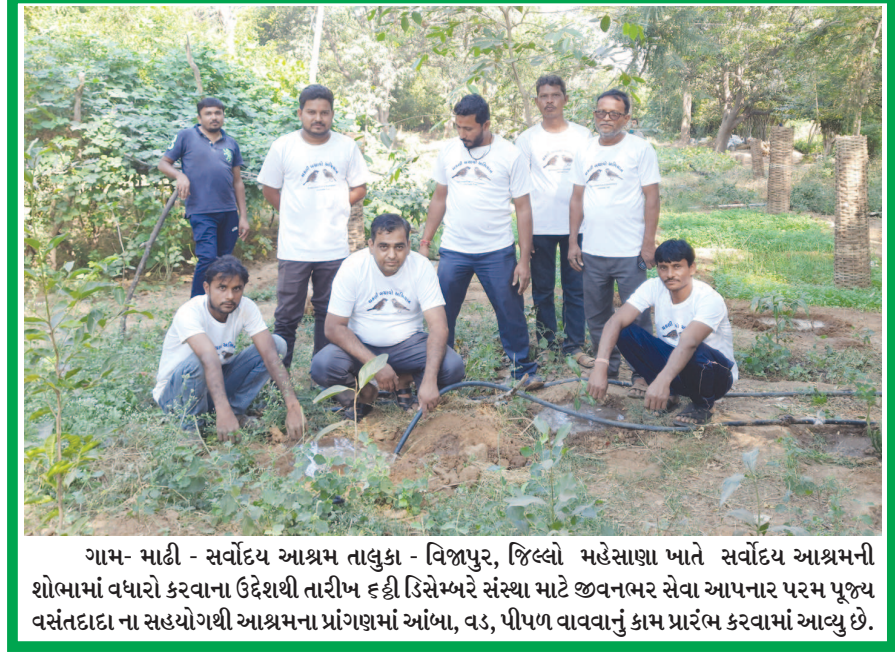
ગામ- માદી - સર્વોદય આશ્રમ તાલુકા - વિજાપુર, જિલ્લો મહેસાણા ખાતે સર્વોદય આશ્રમની શોભામાં વધારો કરવાના ઉદ્દેશથી તારીખ ૬ ડી સેપ્ટેમ્બરે સંસ્થા માટે જીવનભર સેવા આપનાર પરમ પૂજ્ય વસંતદાદા ના સહયોગથી આશ્રમના પ્રાંગણમાં આંબા, વડ, પીપળ વાવવાનું કામ પ્રારંભ કરવામાં આવ્યું છે.