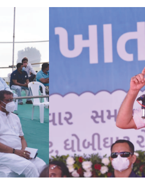
પુરતી માત્રામાં આપવા આ સરકાર સંકલ્પબદ્ધ છે.

નાયબ મુખ્યમંત્રીશ્રી નીતિભાઈ પટેલે આ પ્રસંગે જણાવ્યું કે, પીવાના પાણી અને સિંચાઈમાં ગુજરાત રાજ્ય આત્મનિર્ભર બને તે દિશામાં મક્કમતાથી આપણે આગળ વધી રહ્યા છીએ. ગુજરાતના તમામ શહેરો અને ગામડાઓમાં શુદ્ધ પીવાનું પાણી