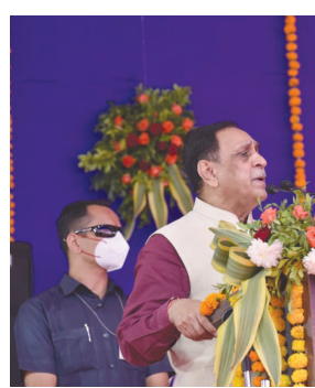
ગામને તો પાણી જ ન મળતું હોય એવી દશા હતી.

કોંગ્રેસના શાસનમાં માત્ર ૪૭૦૦ ગામોમાં પાણી પૂરવઠા યોજનાઓ હતી. ૨૪ ટકા લોકોને નળથી જળ મળતું અને બે બડા પાણી માટે બહેનોને ગાઉના ગાઉ જતું પડતું. જૂથ પાણી પૂરવઠા યોજનાઓની પાઈપલાઈન ભાંગી તૂટી હાલતમાં હોય અને છેવાડાના