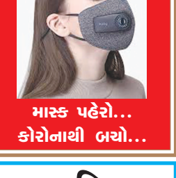
માસ્ક પહેરો... કોરોનાથી બચો...