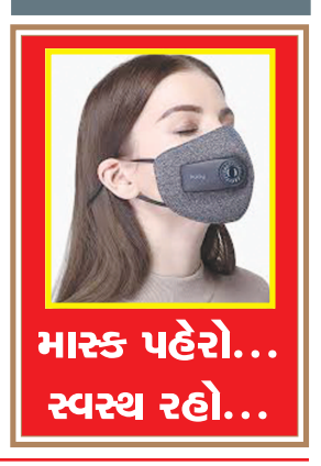
માસ્ક પહેરો... સ્વસ્થ રહો...

જન્મદિને વધામણી વિભાગ અંતર્ગત કોઈપણ વાયક પોતાની તસવીરો પ્રકાશન માટે મોકલી શકે છે. પરંતુ, વાયકોને વિનંતી છે કે મોડામાં મોડો આ તસવીરો જન્મદિવસ હોય તેના અગાઉના દિવસે એક વાગ્યા સુધીમાં અખબારને મળી જાય. વાયકો ઈચ્છે તો આ વિભાગમાં પ્રકાશન હેતુ પોતાની તસવીરો અગાઉથી પણ મોકલાવી શકે છે.