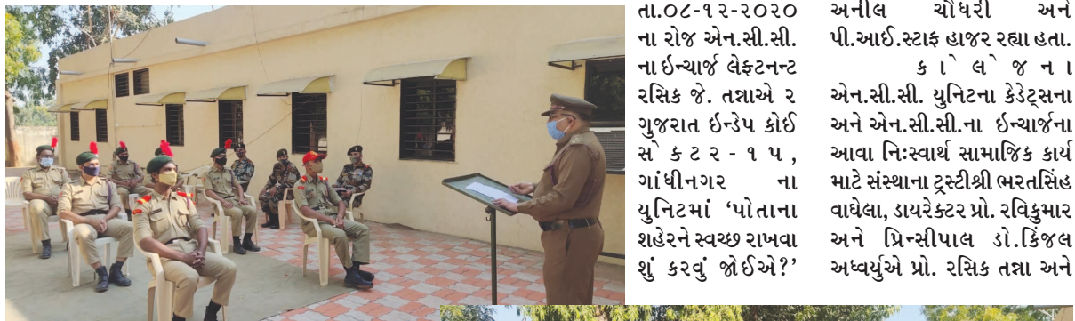
સંચાલિત શંકરસિંહ વાઘેલા બાપુ ઈન્સ્ટીટ્યુટ ઓફ ટેકનોલોજી અભ્યાસકીય પ્રવૃત્તિઓ ઉપરાંત સામાજિક પ્રવૃત્તિઓમાં પણ હમેશા અગ્રેસર રહે છે. કોલેજમાં ૨૦૧૯ થી શરૂ કરેલા એન.સી.સી. કોર્પના કેડેટ્સ ગવર્નમેન્ટ ઓફ ઈન્ડિયા દ્વારા શરૂ કરાયેલ સ્વચ્છ પખવાડિયાના કાર્યક્રમમાં સ્વયં સેવક તરીકે જોડાયા છે. ગવર્નમેન્ટ ઓફ ઈન્ડિયાએ દર વર્ષે ૦૧ જાહેર કર્યો છે. આ અંતર્ગત અનેક પ્રકારના કાર્યક્રમો જેવા કે સેમીનાર ઓ િત હા િસ ક સ્થળોની સ્વચ્છતા, હાઈજેનિક ડે, હેન્ડ વોશ ડે, પબ્લિક પાર્કની સ્વચ્છતા વગેરે જેવા અનેક કાર્યક્રમો ઉજવે છે, જેમાં કોલેજના એન.સી.સી. કેડેટ્સ નિ:સ્વાર્થ