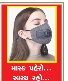
માસ્ક પહેરો... સ્વસ્થ રહો...

જન્મદિને વધામણી વિભાગ અંતર્ગત કોઈપણ વાચક પોતાની તસવીરો પ્રકાશન માટે મોકલી શકે છે. પરંતુ, વાચકોને વિનંતી છે કે મોડામાં મોડી આ તસવીરો જન્મદિવસ હોય તેના અગાઉના દિવસે એક વાગ્યા સુધીમાં અખબારને મળી જાય. વાચકો ઈચ્છે તો આ વિભાગમાં પ્રકાશન હેતુ પોતાની તસવીરો અગાઉથી પણ મોકલાવી શકે છે.