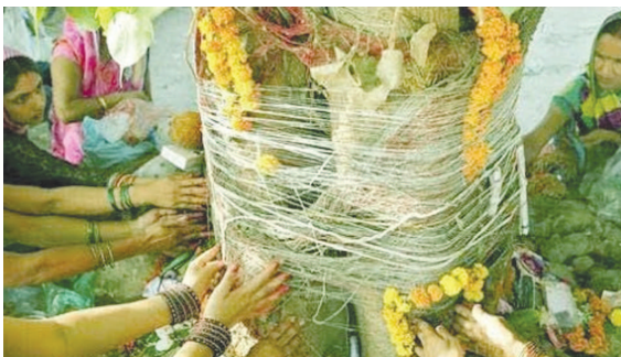
આવા સોમવારના શુભ દિવસે પીપળાના વૃક્ષની આસપાસ વ્રતધારી આવૃત - ઉપાસનાની શિવને પ્રાર્થના કરી પૂર્ણ કરશે.

સોમવતી અમાસએ ભાવનાત્મક એકતાનું પર્વ છે. એકતા અને અખંડિતતાનું પ્રતીક છે. આ પરમ પવિત્ર દિવસે વિભિન્ન સ્થાનો - જળાશયો પર પવનસ્નાન કરવું અતિહિતકારી અને પૂજ્યકારી ગણાય છે. આ પવિત્ર સોમવતી અમાસનું મહત્વ સત્યગથી છે. વિક્રમ સંવત - ૨૦૭૭ ચૌદમી ડીસેમ્બર-૨૦૨૦ને કારતક વદ - અમાવાસ્યાને સોમવાર એટલે સોમવતી અમાવાસ્યા. કારતક માસનો અંતિમ દિવસ - દર્શ સોમવતી અમાસ. આજે ખગ્નાસ સૂર્યગ્રહણ છે જે ભારતમાં દેખાવાનું નથી. હવામાનમાં ફેરફાર થયો છે. કોરોના કોવીડનો આતંક પણ છે. શિવાલયોમાં યજ્ઞ-હોમ હવન દાન દક્ષિણાને વ્રતધારી આવૃત - ઉપાસનાની શિવને પ્રાર્થના કરી પૂર્ણ કરશે. સોમવતી અમાસનું મહાત્મ્ય દર્શાવતી એક દંતકથા આપણે જોઈશું.