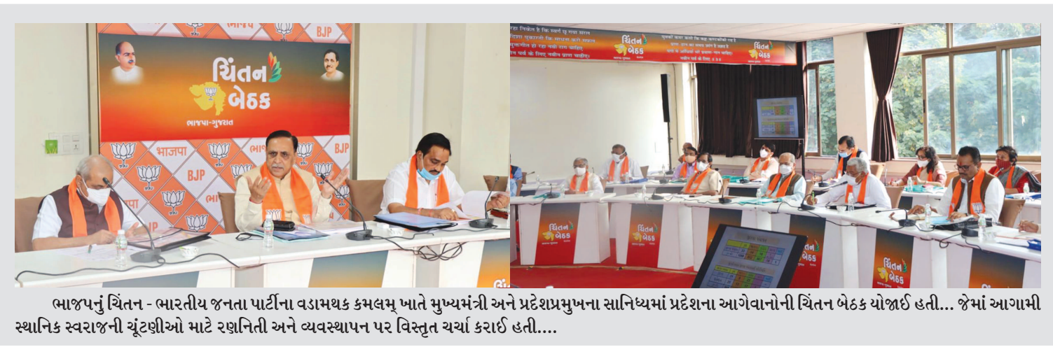
ભાજપનું ચિંતન - ભારતીય જનતા પાર્ટીના વડામથક કમલમ ખાતે મુખ્યમંત્રી અને પ્રદેશપ્રમુખના સાનિધ્યમાં પ્રદેશના આગેવાનોની ચિંતન બેઠક યોજાઈ હતી... જેમાં આગામી સ્થાનિક સ્વરાજની ચૂંટણીઓ માટે રણનીતિ અને વ્યવસ્થાપન પર વિસ્તૃત ચર્ચા કરાઈ હતી....