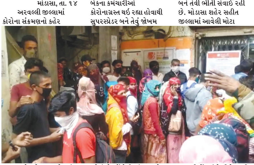
મોડાસા, તા. ૧૪ અરવલ્લી જિલ્લામાં કોરોના સંક્રમણનો કહેર બેંકના કર્મચારીઓ કોરોનાગ્રસ્ત થઈ રહ્યા હોવાથી સુપરસ્પ્રેડર બને તેવું જોખમ બને તેવી ભીતી તેવાઈ રહી છે. મોડાસા શહેર સહીત જિલ્લામાં આવેલી મોટા સરકારે મેળા પર પ્રતિબંધ લગાવી દીધો છે ત્યારે બીજાભાગ્યું બેંકમાં મેળા જેવો માહોલ જોવા મળી રહ્યો છે. વહીવટી તંત્ર અને પોલીસતંત્ર ગ્રાહકોના મેળા કરતી બેંકો સામે દંડાત્મક અને કાયદેસરની કાર્યવાહી ક્યારે કરશે તેવી ચર્ચા ચાલી રહી છે. ગ્રાહકો માટે યોગ્ય સુવિધા ઉભી કરી કોરોના સંક્રમણ ફેલાતું અટકાવવામાં નહિ આવે તો આગામી સમયમાં અરવલ્લી જિલ્લામાં કોરોનાનો વિસ્ફોટ થશે. મોડાસા શહેરમાં આવેલી બેંક ઓફ બરોડામાં અન્ય બેંકો વિલિનીકરણ થયા પછી દરરોજ મેળા જેવો માહોલ પ્રવર્તી રહ્યો છે, બેંક બહાર ગ્રાહકોની ભીડ જોતા કોરોનાને આમંત્રણ આપી રહ્યા હોય તેવા દ્રશ્યો જોવા મળી રહ્યા છે. સોશયલ ડિસ્ટન્સના

કોરોના સ્પ્રેડર બને તો નવાઈ નહીં મોડાસા શહેરની બેંક ઓફ બરોડા સહીતની બેંકમાં હકકડે ઠઠ ભીડ