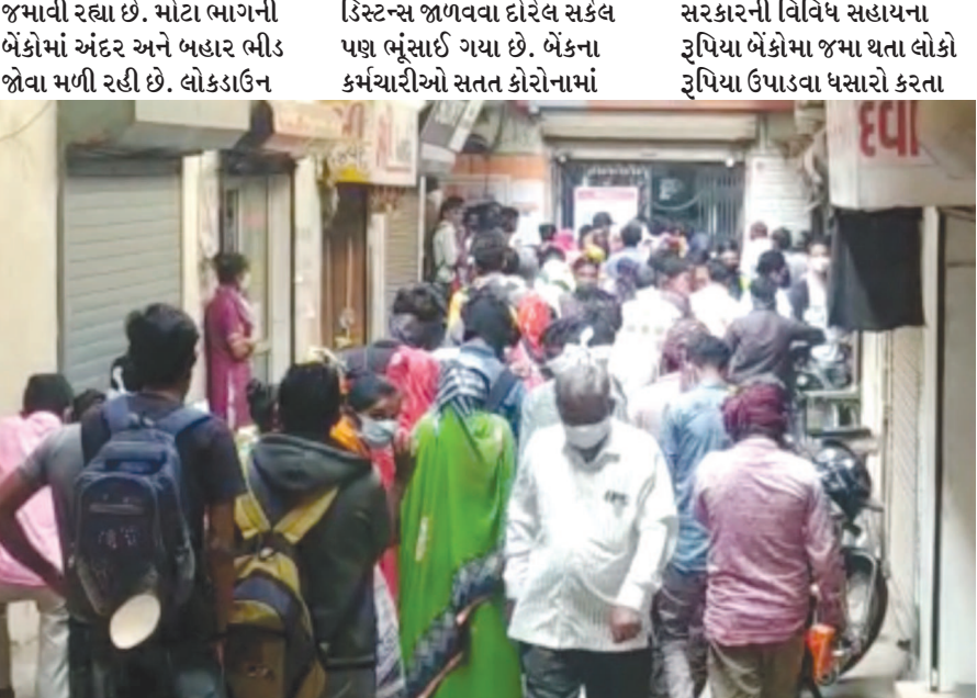
ખાદ છૂટછાટ દરમિયાન બેંકો બહાર અને અંદર સોશયલ ડિસ્ટન્સ જાળવવા દોરેલ સર્કલ પણ ભૂંસાઈ ગયા છે. બેંકના કર્મચારીઓ સતત કોરોનામાં સરકારની વિવિધ સહાયના રૂપિયા બેંકોમાં જમા થતા લોકો રૂપિયા ઉપાડવા ધસારો કરતા

ખજાગરા ઉડી રહ્યા છે, ગ્રાહકોમાં પણ માર્ક પહેર્યા વગર લાપરવાહ જણાઈ રહ્યા છે. બેંક ઓફ બરોડામાં બેંક મર્જ થતા વિદ્યાર્થીઓ પણ નવા ખાતા નંબર મેળવવા કતારમાં ઉભા રહી ગયા હતા. શહેરની મોટા ભાગની બેંકમાં કોરોના સંક્રમણને લઈને સરકારે જાહેર કરેલી ગાઈડલાઈનના ધજ્યા ઈનીયર અને પોલીસતંત્ર પણ બેંક સામે ઘૂંટણીયે પડી ગઈ હોય તેવું લોકો અહેસાસ અનુભવી રહ્યા છે. અરવલ્લી જિલ્લામાં કોરોનાથી લોકોના ટપોટપ મોત નીપજી રહ્યા છે. સતત લોકો કોરોનાગ્રસ્ત બની રહ્યા હોવા છતાં જાણે કોરોનાનો ડર ના રહ્યો તેમ લોકો સોશિયલ ડિસ્ટન્સનો ભંગ કરી ભીડ