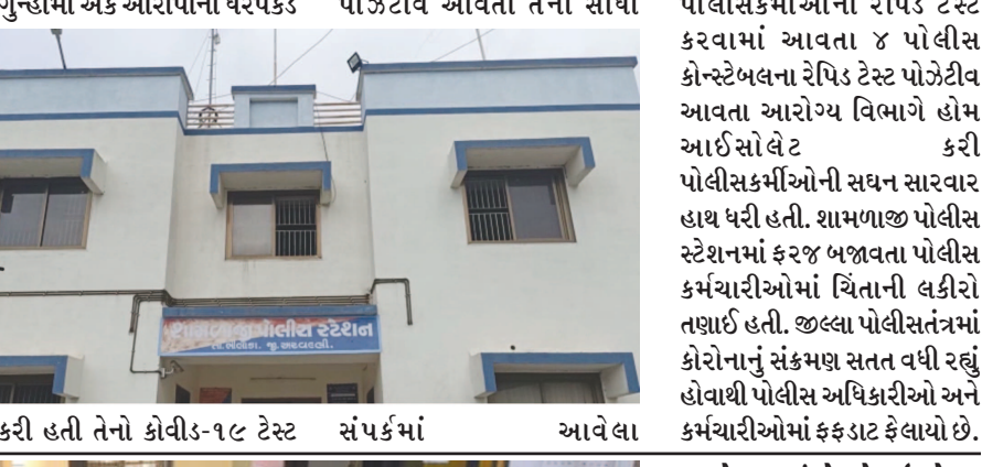
ગુન્હામાં એક આરોપીની ધરપકડ પોઝેટીવ આવતા તેના સીધા પોલીસકર્મીઓના રેપિડ ટેસ્ટ કરવામાં આવતા ૪ પોલીસ કોન્સ્ટેબલના રેપિડ ટેસ્ટ પોઝેટીવ આવતા આરોગ્ય વિભાગે હોમ આઈસોલેટ કરી પોલીસકર્મીઓની સઘન સારવાર હાથ ધરી હતી. શામળાજી પોલીસ સ્ટેશનમાં ફરજ બજાવતા પોલીસ કર્મચારીઓમાં ચિંતાની લકીરો તણાઈ હતી. જિલ્લા પોલીસતંત્રમાં કોરોનાનું સંક્રમણ સતત વધી રહ્યું હોવાથી પોલીસ અધિકારીઓ અને કર્મચારીઓમાં ફફડાટ ફેલાયો છે.

શામળાજી, તા. ૧૪ અરવલ્લી જિલ્લા પોલીસતંત્રમાં ફરજ બજાવતા અનેક અધિકારીઓ અને કર્મચારીઓ કોરોનાનો શિકાર બની રહ્યા છે. પોલીસ અધિકારીઓ અને કર્મચારીઓ ફાઈનાલ નોરિયસ હોવાથી લોકોના અને કોરોનાગ્રસ્ત આરોપીઓના સંપર્કમાં સીધા આવતા હોવાથી કોરોના સંક્રમિત બની રહ્યા છે. શામળાજી પોલીસ સ્ટેશનમાં ફરજ બજાવતા ૪ પોલીસકર્મીઓ એક સાથે