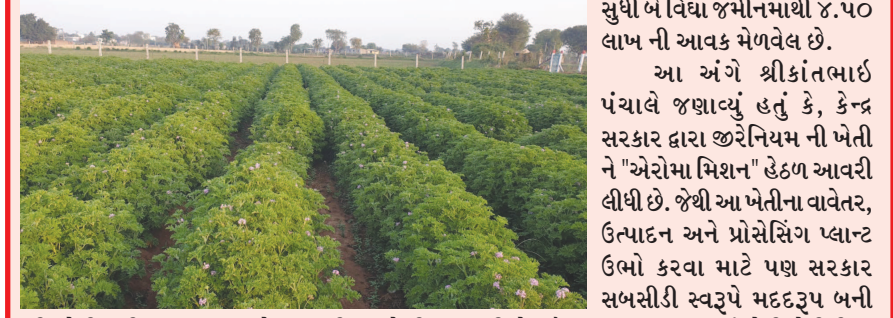
જોના દ્વારા જીરેનિયમનું તેલ કાઢી શકાય છે. આ પાકની દર ૩ થી ૪ મહીને કાપણી થાય છે અને ત્યાર બાદ એમાંથી તેલ કાઢવામાં આવે છે. અત્યાર સુધી બે વિદ્યા જમીનમાંથી ૪.૫૦ લાખ ની આવક મેળવેલ છે.

ડીસા તાલુકાના ભોયણ ગામના યુવાન ખેડૂતે જોના દ્વારા જીરેનિયમનું તેલ કાઢી શકાય છે. આ પાકની દર ૩ થી ૪ મહીને કાપણી થાય છે અને ત્યાર બાદ એમાંથી તેલ કાઢવામાં આવે છે. અત્યાર સુધી બે વિદ્યા જમીનમાંથી ૪.૫૦ લાખ ની આવક મેળવેલ છે.