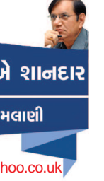
આવો જીવીએ શાનદાર વિનોદ અમલાણી

ઔપચારિક સંબંધો કઈ જ કામના નથી હોતા. એવું માનવા પાછળનું કારણ એ હોય કે એવા સંબંધો થકી આપણને કોઈ જ પ્રકારનો આનંદ માણી શકતા નથી. હા, કોઈ એવી મોટી, વિખ્યાત, નામાંકિત, મોભાદાર વ્યક્તિ સાથે જો આપણને એ પ્રકારના ઔપચારિક સંબંધો હોય તો ક્યારેક આપણે એવું ખોટું ગૌરવ લઈ શકીએ કે ફલાણી વ્યક્તિ સાથે મારે ઓળખાણ છે. ભલે એ ઓળખાણ માત્ર નામ પૂરતી જ હોય, ઔપચારિક જ હોય. ઔપચારિક સંબંધો ગમે એટલી સંખ્યામાં હોય, તેને ઓછા ના કરીએ. એ સંબંધોને ભલે 'જેમ છે એમ જ' જ રહેવા દઈએ, જ્યાં છે ત્યાં જ તેને ટકાવી રાખીએ તો એમાં કોઈ જ પ્રકારનું નુકશાન તો નથી જ કારણકે એ સંબંધોને સાચવી રાખવા માટે આપણે સમય, શક્તિ કે નાણાંનો કોઈ જ પ્રકારનો ખર્ચ કરવો પડતો નથી. ઔપચારિક સંબંધોનું મૂલ્ય પણ ક્યારેય ઓછું ના આંકી શકાય. અનેક ઔપચારિક સંબંધોમાંથી કેટલાક યુનુંદા સંબંધોને જો આપણે ધીમે ધીમે વિકસાવી શકીએ તો એ સંબંધો આપણાં માટે ક્યારેક અત્યુલ્લેખ બન્યાનો સાબિત થઈ શકે છે. અનેક અનોપચારિક સંબંધોમાંથી કોઈ એકાદ બે સંબંધો પણ જો સારી રીતે વિકસી શકે,