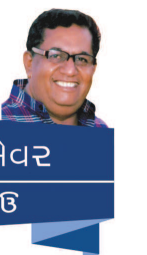
નાવં કટેવર નટવર હેડાઈ

દૂધની બહાર કાઢી જોવા લાગ્યો. રાજાએ પૂછ્યું, 'આ શું કરે છે?' છોકરાએ કહ્યું, 'એવું સાંભળવામાં આવ્યું છે કે દૂધમાં માખણ હોય છે. હું એ જ જોઈ રહ્યો છું કે દૂધમાં માખણ ક્યાં છે?' રાજાએ કહ્યું, 'તારી વાત સાચી છે. દૂધમાં માખણ હોય છે. પરંતુ તે દેખાયું નથી. દૂધને જમાવીને દહીં બનાવવામાં આવે છે. દહીંને વલવીને અત્યારે માણસ મળે છે.' બ્રાહ્મણના દીકરાએ કહ્યું, 'મહારાજ આ તમારા પહેલા સવાલનો જવાબ છે. પરમાત્મા પ્રત્યેક જીવમાં વિદ્યમાન છે. તેને મેળવવા માટે પૂજા, પાઠ, જપ, તપ કરવા પડે છે.' જવાબ સાંભળીને રાજા ખુશ થયો અને કહ્યું 'હવે મારા બીજા સવાલનો જવાબ આપ.' ઈશ્વર ક્યાં છે? બ્રાહ્મણના દીકરાએ તરત એક મીણબત્તી મંગાવી - અને તેને પેટાવીને રાજાએ કહ્યું, 'મહારાજ આ મીણબત્તી ક્યાં પ્રકાશ ફેંકે છે? રાજાએ કહ્યું, 'મીણબત્તીનો પ્રકાશ ચારેબાજુ ફેલાય છે.' છોકરાએ કહ્યું, 'આ તમારા બીજા સવાલનો જવાબ છે. પરમાત્મા બધી દિશાઓમાં દરેક થતાં કહ્યું, 'સારું, તો હવે તું મને મારા છેલ્લા સવાલનો જવાબ આપ.' પરમાત્મા શું કરે છે?' બ્રાહ્મણના દીકરાએ પૂછ્યું, 'આપ મને કહો કે આ સવાલનો જવાબ તમે મને ગુરુ બનીને પૂછો છો કે શિષ્ય બનીને?' રાજાએ વિનમ્રતાથી કહ્યું, 'હું આ પ્રશ્ન શિષ્યબનીને પૂછી રહ્યો છું.' આ સાંભળી છોકરાએ કહ્યું, 'વાહ, મહારાજ, તમે ભલે શિષ્ય રહ્યા. ગુરુ નીચે જમીન પર અને શિષ્ય સિંહાસન પર બિરાજમાન છે.' આ સાંભળી રાજા પોતાના સિંહાસન પરથી નીચે ઉતર્યા અને બ્રાહ્મણના દીકરાને સિંહાસન પર બેસાડી પૂછ્યું, 'હવે કહે ઈશ્વર શું કરે છે?' જવાબ મળ્યા 'હવે કહેવાનું શું બાકી છે. ઈશ્વર રાજાને રંગ અને રંક ને રાજા બનાવી દે છે.' રાજાએ ખુશ થઈ તેને સલાહકાર તરીકે રાખી લીધો.