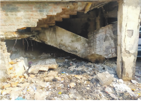
ગાંધી કોમ્પ્લેક્સ આવેલું છે જેમાં અનેક ટુકાનો ઓફિસો આવેલી

ડીસા, તા. ૧૫ ડીસાની મધ્યમાં ફુવારા સર્કલ નજીક આવેલા અને પાલિકા દ્વારા નિર્મિત રાજીવ હોઈ દિવસ દરમિયાન અનેક લોકોની અવર જવર પણ રહેતી હોય છે. લાંબા સમયથી આ કોમ્પ્લેક્સના પાછળનો સિડીનો