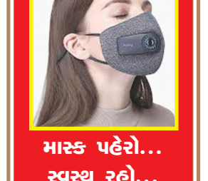
માસ્ક પહેરો... સ્વસ્થ રહો...