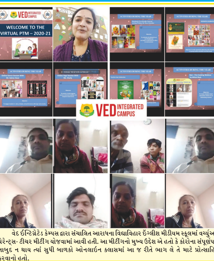
વેદ ઈન્ટિગ્રેટેડ કેમ્પસ દ્વારા સંચાલિત આરોપના વિદ્યાવિહાર ઈંગ્લીશ મીડીયમ સ્કૂલમાં વચ્ચુંઅલ પેરેન્ટ્સ-ટીચર મીટિંગ યોજવામાં આવી હતી. આ મીટિંગનો મુખ્ય ઉદ્દેશ એ હતો કે કોરોના સંપૂર્ણપણે નાબુદ ન થાય ત્યાં સુધી બાળકો ઓનલાઈન ક્લાસમાં આ જ રીતે ભાગ લે તે માટે પ્રોત્સાહિત કરવાનો હતો.