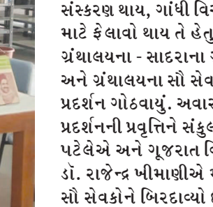
ચિલોડા, તા. ૧૮