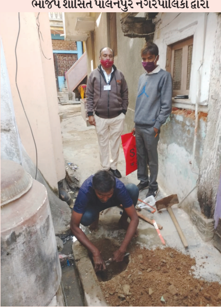
શહેરમાં જુદી-જુદી ટીમો બનાવી પાણીના નળ કનેક્શનની ચકાસણી કરવામાં આવી રહી છે. જેમાં ચકાસણી દરમિયાન બે રહીશો દ્વારા એક કરતા

ગેરકાયદેસર કનેક્શન રેગ્યુલેટિંગ કરવાની કામગીરી ચાલી રહી છે.