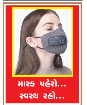
માસ્ક પહેરો... સ્વસ્થ રહો...

જન્મદિને વધામણી વિભાગ અંતર્ગત કોઈપણ વાયક પોતાની તસવીરો પ્રકાશન માટે મોકલી શકે છે. પરંતુ, વાયકોને વિનંતી છે કે મોડામાં મોડી આ તસવીરો જન્મદિવસ હોય તેના અગાઉના દિવસે એક વાગ્યા સુધીમાં અખબારને મળી જાય. વાયકો ઈચ્છે તો આ વિભાગમાં પ્રકાશન હેતુ પોતાની તસવીરો અગાઉથી પણ મોકલાવી શકે છે.