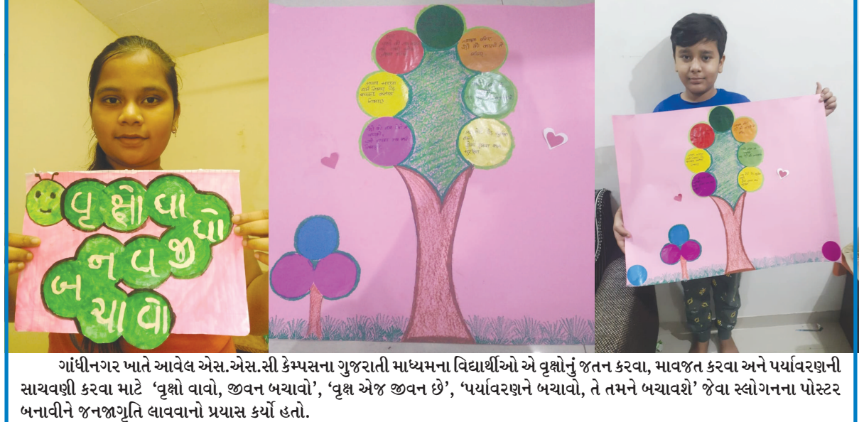
ગાંધીનગર ખાતે આવેલ એસ.એસ.સી કેમ્પસના ગુજરાતી માધ્યમના વિદ્યાર્થીઓએ વૃક્ષોનું જતન કરવા, માવજત કરવા અને પર્યાવરણની સાચવણી કરવા માટે 'વૃક્ષો વાવો, જીવન બચાવો', 'વૃક્ષ એજ જીવન છે', 'પર્યાવરણને બચાવો, તે તમને બચાવશે' જેવા સ્લોગનના પોસ્ટર બનાવીને જનજાગૃતિ લાવવાનો પ્રયાસ કર્યો હતો.