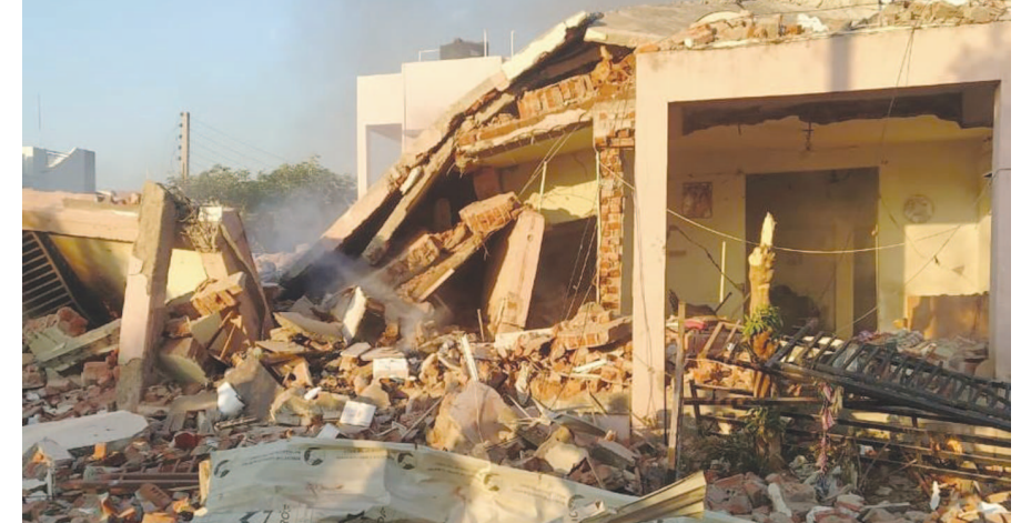
જાણ થતા ઘટના સ્થળે જિલ્લા કલેક્ટર, સહિત ઉચ્ચ અધિકારીઓ દોડી ગયા હતા.

દરમિયાન વ્યક્તિનું મૃત્યુ નિપજયુ હતું. કાટમાળ નીચે આગની જવાળાઓ પણ ચાલુ હતી. જયારે ધડાકાને પગલે આસપાસના