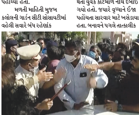
ગાર્ડન સીટી સોસાયટી ખાતે નાગરીકોના ટોળે ટોળા ઉમટી પડ્યા હતા. જયારે બનાવની

મકાનનો પણ નુકશાન પહોંચ્યું હતું. જયારે ભેદી ધડાકાનો અવાજ દુરદુર સુધી સંભળાયો