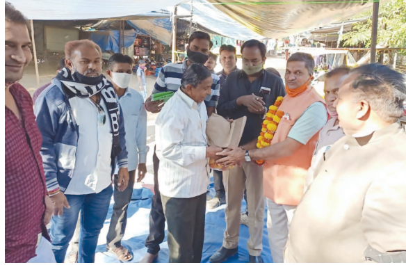
પ્રગતિ લારી પાથરણાં મંડળની વાર્ષિક સાધારણ સભામાં દરેક વેપારી સભ્યો ઉપસ્થિત રહ્યાં હતા અને નૂતન વર્ષની શુભેચ્છાઓ સાથે મંડળની ગત વર્ષની

ગાંધીનગર, તા. ૨૨ ગાંધીનગરમાં મીના બજાર ખાતેથી કાર્યરત પ્રગતિ લારી પાથરણાં મંડળની તા. ૨૧ મી ડિસેમ્બર સોમવારના રોજ વાર્ષિક સાધારણ સભા યોજાઈ હતી. આ સભામાં આગામી વર્ષ માટે નવા હોદ્દેદારોની નિમણૂક હાથ ધરવામાં આવી હતી. જેમાં કામગીરીની સમીક્ષા હાથ ધરાઈ હતી. આ સાથે આગામી વર્ષ માટે નવા હોદ્દેદારોની નિમણૂક કરવામાં આવી હતી જેમાં સતત સળંગ