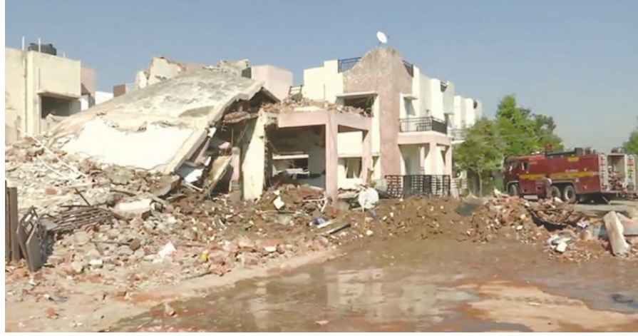
વિસ્તારમાં આવેલી ગાર્ડન સીટી સોસાયટીના બંધ મકાનમાં મંગળવારની વહેલી સવારે અચાનક જોરદાર ધડાકો થયો હતો. ધડાકાની તીવ્રતા એટલી જોરદાર હતી કે બે મકાન

ગાંધીનગર, તા. ૨૨ ગાંધીનગર જિલ્લાના કલોલ શહેરની પંચવટી ધરાશાય થઈ ગયા હતા. જયારે કલોલવાસીઓ ભુકંપ આવ્યો હોવાનું સમજાવવા બહાર દોડી