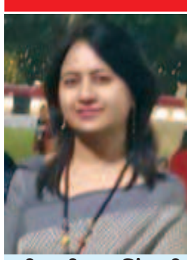
મીનાક્ષી જયસિંદાની લાયોનેસ ક્લબ