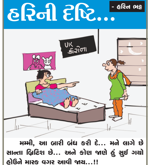
મમ્મી, આ બારી બંધ કરી દે... મને લાગે છે સાલ્વા ફિટિશ છે... અને કોણ બાણે હું સુઈ ગયો હોઉંને માસ્ક વગર આવી જાય...!!