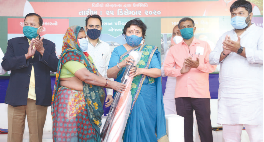
માહાસા ખાતે સુશાસન દિવસની ઉજવણી

અમદાવાદ શહેરના આંબલી ગામમાં આવેલા પ્રિન્ટિંગ પ્રેસમાં એક યુવક રાજસ્થાન જિલ્લાના એસઓજીના કહેવાથી રાજસ્થાનના શિક્ષણમંત્રી ગોવિંદસિંગના ઓફિસર ઓન સ્પેશિયલ ડ્યુટી તરીકેની ઓળખ આપી પેપર લીક કેસની તપાસ કરવા આવ્યો હતો. પ્રેસના વલીવટી કર્મચારીએ યુવક પાસે