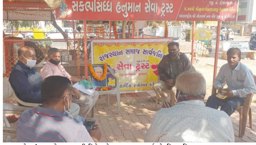
શહેરમાં શુક્રવારે તા. ૨૫મી ડિસેમ્બરે ભારતના ભૂતપૂર્વ લોકપ્રિય કવિ હૃદય વડાપ્રધાન સ્વ. અટલ બિહારી બાજપાઈજીની જન્મજયંતિની વિવિધ સ્થળે ઉજવણી કરવામાં આવી હતી. આ અંતર્ગત ગાંધીનગરના રાજસ્થાન સમાજ સાર્વજનિક સેવા ટ્રસ્ટ દ્વારા સેક્ટર-૨ ૧માં હનુમાન મંદિરે યોજવામાં આવેલા કાર્યક્રમમાં સ્વ. અટલ બહારી બાજપાઈજીને શ્રધ્ધાંજલિ અર્પણ કરવામાં આવી હતી જે માટે સંસ્થાના હોદ્દાદારોએ ઉપસ્થિત રહી પુષ્પાંજલિ અર્પિત કરી હતી.