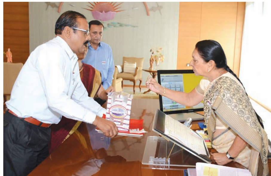
સુરક્ષાદળોના જવાનોની સમર્પિત ભાવનાનો પ્રહાર સ્વીકાર કરી મુખ્યમંત્રીએ ફાળો અર્પણ કર્યો

ગાંધીનગર, તા. ૭ ગાંધીનગર શહેરમાં સ્માર્ટ સીટી પ્રોજેક્ટ અંતર્ગત હાઈરાઈઝ બિલ્ડીંગનો પ્રોજેક્ટ ભારત સરકારને સૂચવવાની તૈયારી કરવામાં આવી છે.