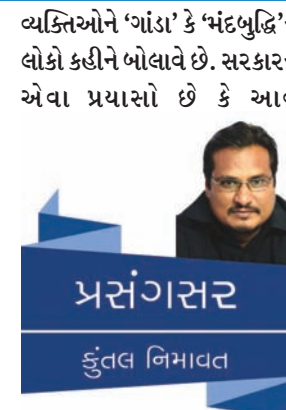
પ્રસંગસર કુંવલ નિમાવત

માનસિક વિશિષ્ટ વ્યક્તિઓ માટેનો દિવસ એ માત્ર એમના માટેનો જ દિવસ છે એવું નથી, હકીકતે આ દિવસ છે સામાન્ય વ્યક્તિઓનું વિશિષ્ટ વ્યક્તિ તરફ ધ્યાન દોરવાનો ને એમ કરીને એમને સમાજની નજદીક લાવવાનો પ્રયાસ કરવાનો. એ માટે પ્રથમ તો માનસિક વિશિષ્ટ લોકો પ્રત્યે આપણી દૃષ્ટિ અને અભિગમ બદલવાની જરૂર છે. આજે પણ સમાજનો મોટો વર્ગ આવી