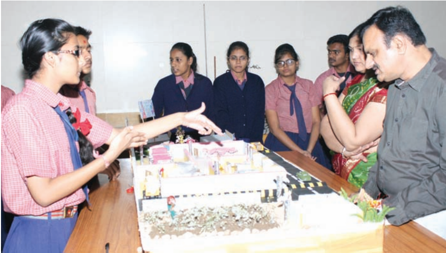
કોબા સર્કલ પાસે સ્થિત મહાપ્રજ્ઞા વિદ્યા નિકેતન સ્કૂલ ખાતે શુક્રવારે ગ્લોબલ વોર્મિંગ તથા વિજ્ઞાન, પર્યાવરણ વિષયક જાગૃતિ અંગે કૃતિઓનું પ્રદર્શન તથા ફન ફેર યોજવામાં આવ્યો હતો. આ પ્રસંગે વિદ્યાર્થીઓએ વિવિધ વાનગીઓના સ્ટોલ્સ પણ ઊભા કર્યા હતા.