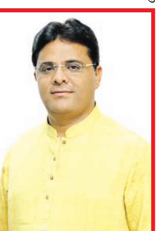
માર્કેટ્યાર્ડના ચેરમેન બનાબાદ માર્કેટ્યાર્ડના વહીવટમાં અનેક સુધારા કરી ખેડૂતો, વેપારીઓ, તોલાટ-હમાલોના હિત સુચારૂ કાર્ય કરી તમામને લાભ આપવા સાથે

કુશળ વહીવટકર્તા તરીકે ડીસા માર્કેટ્યાર્ડમાં કદર કરતા મતદારો