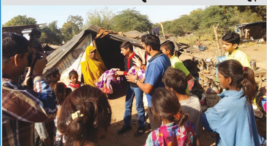
સહજાનંદ સ્કૂલ ઓફ એચીવર, ચિલોડા દ્વારા મોનસૂન ફંડરીવલની ઉજવણીના ભાગરૂપે વિવિધ સ્ટોલ તૈયાર કરવામાં આવ્યા હતા. આ સ્ટોલના માધ્યમથી જે રકમ પ્રાપ્ત થઈ તેનો ઉપયોગ શિયાળામાં પડતી કાળઝાળ ઠંડીથી જે લોકો પોતાની પ્રાથમિક જરૂરિયાતથી વંચિત હોય તેમને ઠંડીથી રક્ષણ આપવા માટે કરવામાં આવ્યો હતો. વિદ્યાર્થીઓએ જરૂરિયાતમંદોના નિવાસસ્થાન સુધી જઈ તેમને બ્લેન્કેટનું વિતરણ કર્યું હતું અને 'આપવાનો આનંદ' પ્રાપ્ત કર્યો હતો.