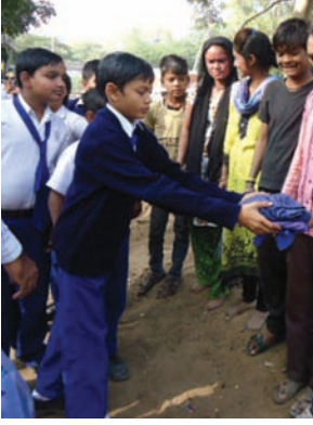
સર્વ વિદ્યાલય કેળવણી મંડળ સંચાલિત શ્રી જે બી પ્રાથમિક શાળાના વિદ્યાર્થીઓ દ્વારા ચરેડી છાપરા ખાતે ગરીબ પરિવારનાં બાળકોને ગરમ શાલ, સ્વેટર, જેકેટ તેમજ અન્ય કપડાંનું વિતરણ કરવામાં આવ્યું હતું. ધોરણ-૭ના આ વિદ્યાર્થીઓએ ગરીબ બાળકોને ગરમ કપડાંનું વિતરણ કર્યા બાદ બલરામ મંદિર ખાતે આયોજિત પુસ્તક મેળાની મુલાકાત લઈ પુસ્તકોની ખરીદી કરી હતી, સાથોસાથ તેમણે સેક્ટર-૨ ૧ પોલીસ સ્ટેશનની મુલાકાત લઈ પોલીસ સ્ટેશનની કાર્યવિધિ અંગે વિશદ માહિતી પ્રાપ્ત કરી હતી.