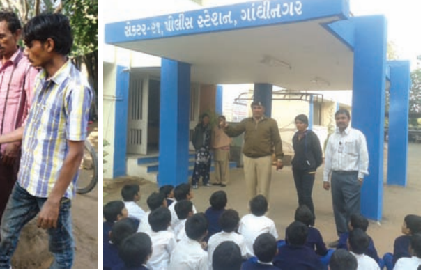
સર્વ વિદ્યાલય કેળવણી મંડળ સંચાલિત શ્રી જે બી પ્રાથમિક શાળાના વિદ્યાર્થીઓ દ્વારા ચરેડી છાપરા ખાતે ગરીબ પરિવારનાં બાળકોને ગરમ શાલ, સ્વેટર, જેકેટ તેમજ અન્ય કપડાંનું વિતરણ કરવામાં આવ્યું હતું. ધોરણ-૭ના આ વિદ્યાર્થીઓએ ગરીબ બાળકોને ગરમ કપડાંનું વિતરણ કર્યા બાદ બલરામ મંદિર ખાતે આયોજિત પુસ્તક મેળાની મુલાકાત લઈ પુસ્તકોની ખરીદી કરી હતી, સાથોસાથ તેમણે સેક્ટર-૨ ૧ પોલીસ સ્ટેશનની મુલાકાત લઈ પોલીસ સ્ટેશનની કાર્યવિધિ અંગે વિશદ માહિતી પ્રાપ્ત કરી હતી.