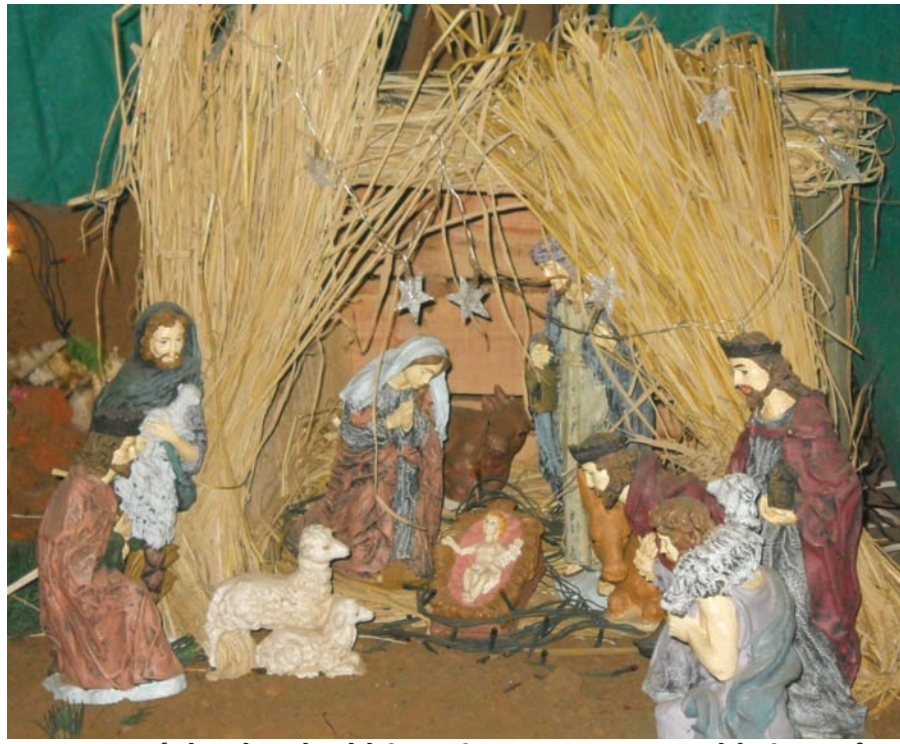
નાતાલનું પર્વ હવે હાથવેતમાં છે ત્યારે તેની ઉજવણી તથા આવકારના સમાચાર ચારેકોરથી પ્રાપ્ત થઈ રહ્યા છે. સેક્ટર- ૫ બી ખાતે પ્લોટ નં. ૧૪૫૧/૧ ખાતે નાતાલને આવકારવા માટે ઈશુના જન્મ પ્રસંગની સુંદર પ્રતિકૃતિએ શહેરમાં આકર્ષણ જાગ્યું છે.