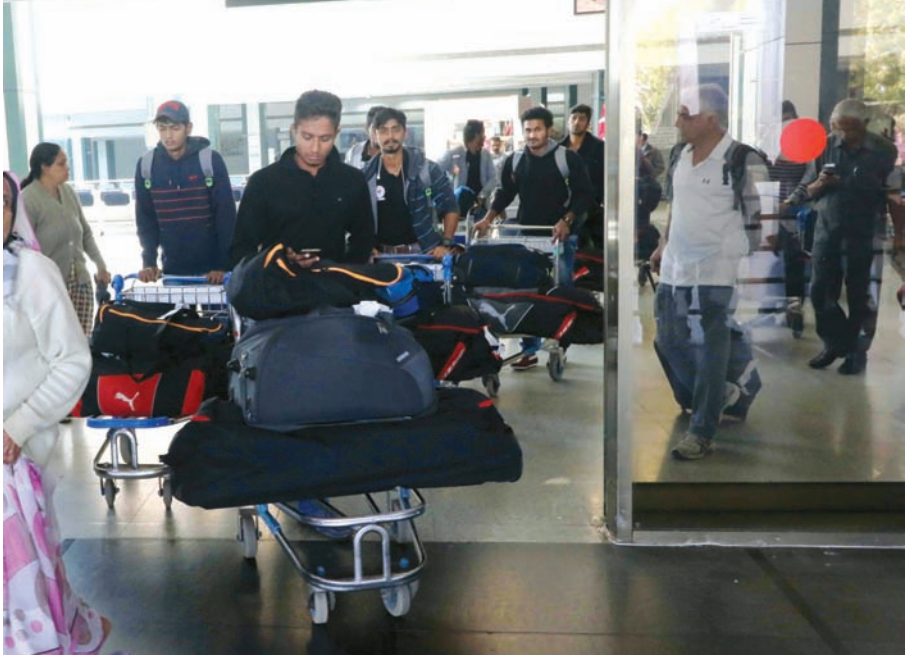
ગુજરાત ગૌરવનું સ્વાગત - વિજય હાટ્ટરે ટ્રોફીમાં વિજેતા બનેલી ગુજરાતની ટીમ અમદાવાદ વિમાની મથકે પહોંચતા સ્વાગત કરાવ્યું છે.