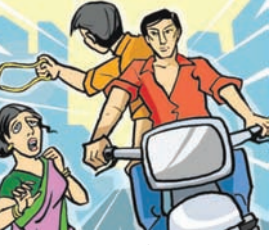
મળતી માહિતી મુજબ સેક્ટર-૨૪ આદર્શનગર પ્લોટ નં.

નાકાબંધી કરી દીધી હતી પરંતુ તેમ છતાં લુંટારૂઓ પોલીસને હાથ આવ્યા ન હતાં.