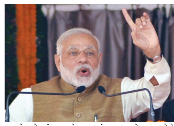
છપાતો હતો પરંતુ આ નોટના બંડલો ગરીબોના ઘરમાં પહોંચતા ન હતા. આ બંડલો

મુરાદાબાદ, તા.૩ વડાપ્રધાન નરેન્દ્ર મોદીએ આજે ઉત્તરપ્રદેશમાં પરિવર્તન રેલીને સંબોધતા વિરોધ પક્ષો ઉપર તેજાબી પ્રહાર કર્યા હતા. મોદીએ કહ્યું હતું કે વિકાસ મારફતે લોકોને વીજળી, પાણી અને ઘર મળશે. તેમણે ઉમેર્યું હતું કે તમામ મુશ્કેલીઓની જડ ભ્રષ્ટાચાર છે. જેથી ભ્રષ્ટાચારને દુર કરવા માટે અમે ખૂબ જ કઠોર પગલાં લઈ ચુક્યા છીએ. અગાઉની સરકારોમાં નોટનો જથ્થો