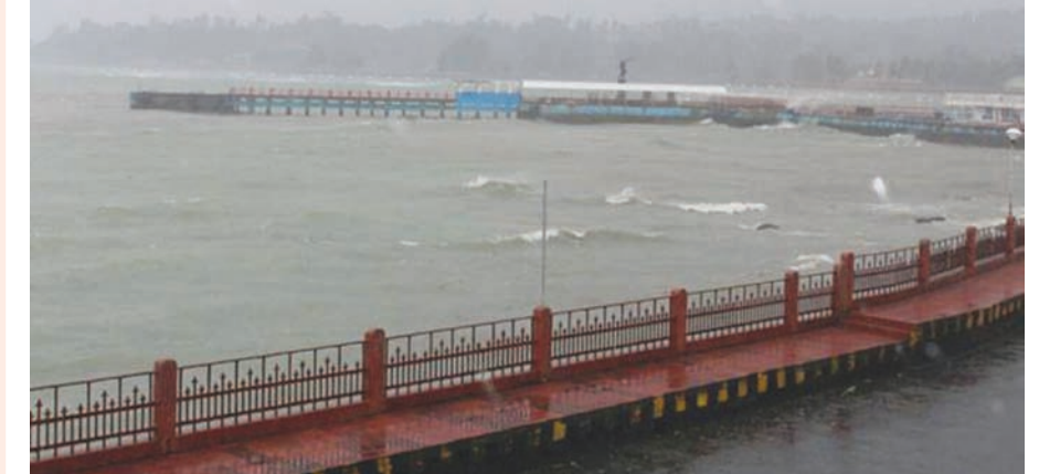
નેવી પરંતુ નેવીના ચાર જહાજ પ્રવાસીઓને બચાવવા માટે કાર્યરત કરી દેવાયા છે. આ અંગે મળતી સ્થાનિક પ્રશાસન આ પ્રવાસીઓને સુરક્ષિત બહાર કાઢવા માટે નેવીની મદદ માંગી હતી. નેવીએ આંદામાન દીપના પૂર્વમાં આવેલો એક દીપ છે જે દક્ષિણ આંદામાન

વિગતો અનુસાર નેવી તરફથી જારી કરવામાં આવેલા એક નિવેદન મુજબ ભારે વરસાદના કારણે હેલ્થકેંદ્ર આઈલેન્ડ ઉપર ૮૦૦ જેટલા પ્રવાસીઓ ફસાઈ જવા પામ્યા છે. અલસીયુ-૩૮ છે. હેલ્થકેંદ્ર પ્રવાસીઓને સુરક્ષિત બહાર કાઢવા માટે નેવીની મદદ માંગી હતી. નેવીએ આંદામાન દીપના પૂર્વમાં આવેલો એક દીપ છે જે દક્ષિણ આંદામાન