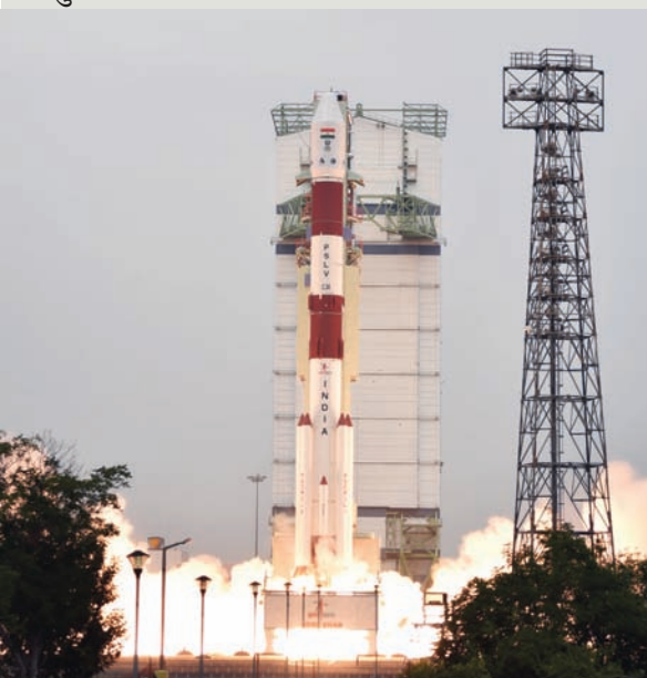
સી.ઈ.ની મદદથી એનું લોન્ચિંગ કરવામાં આવ્યું હતું. આ સાથે જ ઈસરોએ વધુ એક ઉપલબ્ધિ મેળવી છે. આ રિસોર્સસેટ-૧ અને ૨ની કડીનો સેટેલાઈટ છે. લોન્ચિંગથી પહેલો સાઉન્ડિંગ રોકેટ છોડવામાં આવ્યો હતો એ પછી ઈસરોએ અત્યાર સુધી અંતરિક્ષ કાર્યક્રમમાં અનેક સફળતાઓ મેળવી છે.