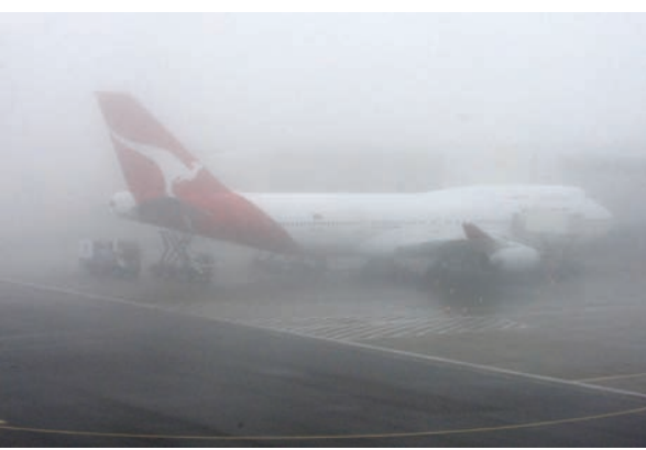
● અનુસંદાન પાન-૭ પર

આવનારા દિવસોમાં પણ ભારે ધુમ્મસથી રાહત મળવાની કોઈ આશા નથી. એટલું જ નહીં પરંતુ આ મહિનાના બીજા અઠવાડિયાની અંદર હજુ પણ આનાથી વધુ ધુમ્મસ જોવા મળી શકે છે. એએનઆઈના અહેવાલ મુજબ ખરાબ વિજિબીલીટીને કારણે ઈન્દિરા ગાંધી ઈન્ટરનેશનલ એરપોર્ટથી ૮ જેટલી ઈન્ટરનેશનલ ફ્લાઈટ પણ લેટ થયેલી છે અને ત્રણ ફ્લાઈટોને ડાયવર્ટ કરવામાં આવી છે. આ ઉપરાંત પાંચ જેટલી ડોમેસ્ટિક