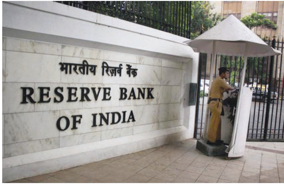
આરબીઆઈની નિરાશાજનક જાહેરાતની વચ્ચે સંસેક્સ-નિફ્ટીમાં ઘટાડો : જીડીપીનો અંદાજ ૭.૬ ટકાથી ઘટાડીને ૭.૧ ટકા કરાયો : રેપોરેટના દર ૬.૨૫ ટકા યથાવત રખાયા : મોંઘવારી વધવાની શંકા વ્યક્ત કરવામાં આવી

સોનાનો ભાવ ઇ મહિનામાં સૌથી નીચો નવી દિલ્હી, તા. ૭ એક તરફ આરબીઆઈ દ્વારા મુદ્રાનીતિ સમીક્ષા બેઠક યોજવામાં આવી હતી જેમાં વ્યાજદરોમાં કોઈ ફેરફારો ન કરવાનો નિર્ણય કરવામાં આવ્યો છે જ્યારે બીજી તરફ સોનાના ભાવમાં સતત ઘટાડાને જારી રહેવા માપ્યો છે. વૈશ્વિક બજારોમાં સતત ઘટાડાના વલણને પગલે સોના ચાંદી બજારમાં પણ સોનાના ભાવમાં ૨૫૦ રૂપિયાથી વધારાનો ઘટાડો નોંધવા પામ્યો છે. સોનાના ભાવ ૨૬૦૦૦ રૂપિયાથી ઘટીને ૨૮૮૦૦ પ્રતિ ૧૦ગ્રામ ઉપર પહોંચી ગયો છે.