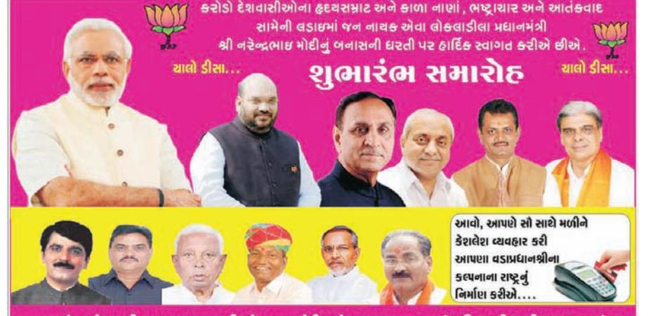
કરોડો દેશવાસીઓના હૃદયસપ્તાહ અને કાળા નાણાં, ભદ્રાચાર અને આતંકવાદ સામેની લડાઈમાં જન નાવક એવા લોકલાડીલા પ્રધાનમંત્રી શ્રી નરેન્દ્રભાઈ મોદીનું બનાસની ઘરતી પર ઠાઠિક સ્વાગત કરીએ છીએ.