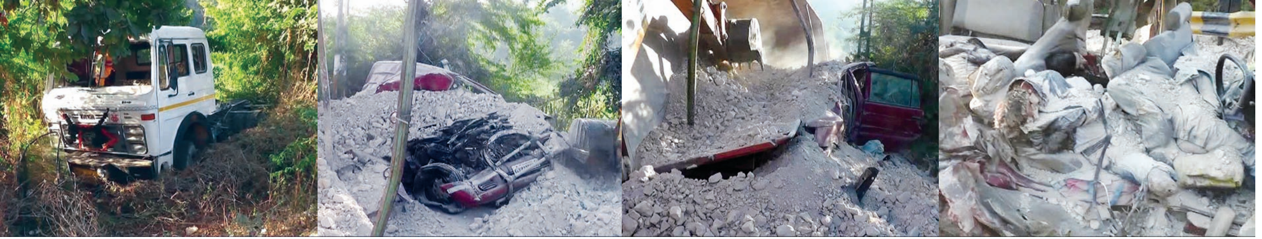
યાત્રાધામ અંબાજી નજીક આજે સવારનાં સુમારે ટવેરા કાર ઉપર ચુનો ભરેલી ટરબો ટ્રક પલટી જતાં ગમખવાર અકસ્માત સર્જાયો છે. અંબાજી આવી રહેલી ટવેરા કાર અને અમદાવાદ તરફ જઈ રહેલી ટરબો ટ્રક ઉભરાઈ ગયા ને ચિખલા ગામની સીમના વળાંકમાં પલટી જતાં ટવેરામાં બેઠેલાં આઠ મુસાફરો પૈકી ૪ યાત્રીકોનાં ઘટના સ્થળેજ મોત નિપજ્યાં છે. ત્યારે અન્ય ૪ યત્કીઓને ગંભીર ઈજાઓ થતાં અંબાજીની કોટેજ હોસ્પિટલમાં લઈ જવાયાં હતા. આ અકસ્માતમાં મૃત્યુ પામનાર અને ઘાયલ યાત્રીકો આણંદનાં અંબાવાગામનાં હોવાનું જાણવામાં મળેલ છે. આ બાબતની જાણ પોલીસને થતાં પોલીસ ઘટના સ્થળે પહોંચી વધુ તપાસ હાથ ધરી છે.