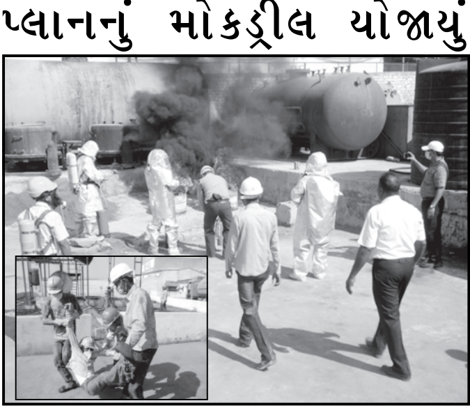
સાબરકાંઠા, તા. ૧૨ સાબરકાંઠા જિલ્લાના નેશનલ હાઈવે નં. ૮ પર કાટવાડ પાટીયા નજીક દલપુર ખાતે આવેલ હેક્ટોરના ઈન્ડસ્ટ્રીયલ પ્લાનના નામના કેમીકલ કારખાનામાં ઈશીલીન ઓફસાઈટ બરીને આવેલ રોડ ટેન્કર ખાલી કરતી વખતે અચાનક ફલેન્જમાંથી ઈશીલીન ઓફસાઈટ ગેસ લીક થઈને તેમાં આગ લાગવાનો સિનારીયો ઉભો કરીને ઓનસાઈટ ઈન્જીનીયરિંગ સર્જન મોકડૂલ કરેલ. ત્યારબાદ, જિલ્લાનું ઓફસાઈટ પ્લાનનું ઓફસાઈટ કરીને જિલ્લા ઓફસાઈટ પ્લાનનું મોકડૂલ કરવામાં આવેલ હતું.