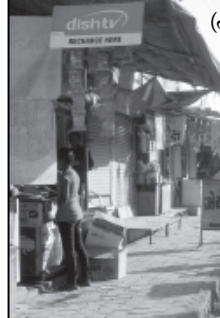
લઈ તેમાં કચરો નાખી પુરી દીધી. આ જગ્યા ઉપર વેપારીઓએ દબાણ કરી દીધા હતા. આથી ડીસા નગરપાલિકાએ થોડા દીવસ પહેલાં વેપારીઓના દબાણ હટાવી જુની ગટરને સાફ કરી તેમાંથી કચરો દુર કરાવી હવે પછી પહેલાંનું પુનરાવર્તન ન થાય તે માટે તેના ઉપર ફુટપાથ બનાવી. પરંતુ ચાર દીન કી ચાંદની ઔર ફીર અંધેરી રાત ની કહેવત

બદલે રોડની વચ્ચે ચાલવું પડે છે. સરદાર પટેલ શોપિંગ અને પશુબજાર શોપિંગ સામે બનાવેલ ફુટપાથ ઉપર ફરી નાસ્તાની લારીઓ ગોઠવાઈ ગઈ છે. જ્યારે સામેની હરોળમાં વેપારીઓએ પોતાના હોર્ડિંગ્સ પાડી દીધા છે. જ્યારે કોલેજ રોડના નાકા પર આવેલી દુકાનોના માલીકોએ તો ફુટપાથ પર ચાની કીટલી અને બાજુની દુકાન