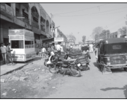
નગરપાલિકાએ વેપારીઓની સગવડ માટે ફુટપાથ બનાવી હોય...? તેમ પોતાના ધંધાની વસ્તુઓ અને માલ સામાન પર પોતાના દ્વારા જાર્ક કરાતા વાહનો તેમજ માલ ઉતારતી ટ્રુકો અને જીપ

આગળ અનાજ લેવેનો ધંધો ચાલુ કરી દીધો છે. જેના કારણે અહીં ટ્રાફિકની સમસ્યા જટીલ બને છે. હાલમાં આ વિસ્તારમાં બનાવેલ ફુટપાથનો લાભ એક પણ રાહદારીને મળ્યો નથી અને વેપારીઓએ તેના પર પોતાનો અડીંગો જમાવી દીધો છે. જાણકે