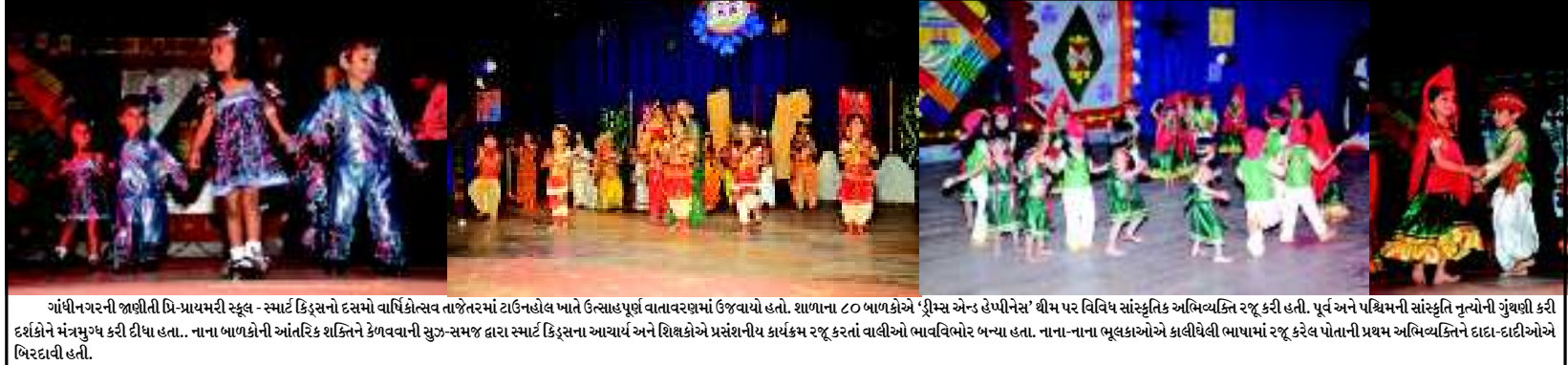
ગાંધીનગરની જાણીતી વિ-આયમરી સ્કૂલ - સ્માર્ટ કિડ્સનો દસમો વાર્ષિકોત્સવ તાજેતરમાં ટાઉનહોલ ખાતે ઉત્સાહપૂર્ણ વાતાવરણમાં ઉજવાયો હતો. શાળાના ૮૦ બાળકોએ 'ડ્રીમ્સ એન્ડ હોપીનેસ' થીમ પર વિવિધ સાંસ્કૃતિક અભિવ્યક્તિ રજૂ કરી હતી. પૂર્વ અને પશ્ચિમની સાંસ્કૃતિક નૃત્યોની ગુંથણી કરી દર્શકોને મંત્રમુગ્ધ કરી દીધા હતા. નાના બાળકોની આંતરિક શક્તિને કેળવવાની સુઝ-સમજ દ્વારા સ્માર્ટ કિડ્સના આચાર્ય અને શિક્ષકોએ પ્રસંસાની ચુક્ર-સમજ રજૂ કરતાં વાલીઓ ભાવવિભોર બન્યા હતા. નાના-નાના ભૂલકાઓએ કાલીથેલી ભાષામાં રજૂ કરેલ પોતાની પ્રથમ અભિવ્યક્તિને દાદા-દાદીઓએ બિરદાવી હતી.