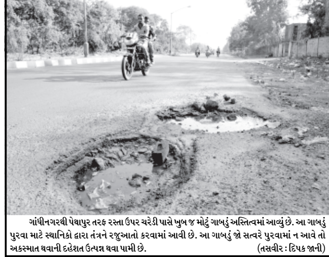
ગાંધીનગરથી પેવાપુર તરફ રસ્તા ઉપર ચરેડી પાસે ખુબ જ મોટું ગાબડું અસ્તિત્વમાં આવ્યું છે. આ ગાબડું પુરવા માટે સ્થાનિકો દ્વારા તંત્રને રજૂઆતો કરવામાં આવી છે. આ ગાબડું જો સત્વરે પુરવામાં ન આવે તો અકસ્માત થવાની દહેશત ઉત્પન્ન થવા પામી છે.