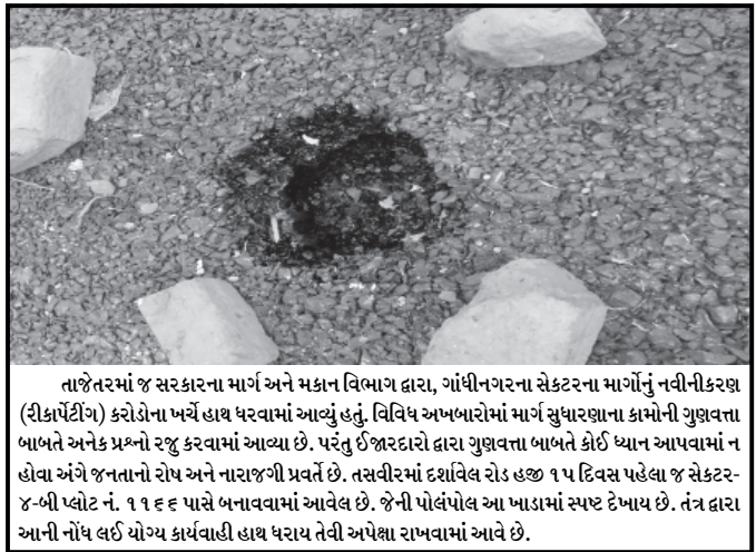
તાજેતરમાં જ સરકારના માર્ગ અને મકાન વિભાગ દ્વારા, ગાંધીનગરના સેક્ટરના માર્ગોનું નવીનીકરણ (રીકાર્પેટિંગ) કરોડોના ખર્ચે હાથ ધરવામાં આવ્યું હતું. વિવિધ અભાગોમાં માર્ગ સુધારણાના કામોની ગુણવત્તા બાબતે અનેક પ્રશ્નો રજૂ કરવામાં આવ્યા છે. પરંતુ ઈજારદારો દ્વારા ગુણવત્તા બાબતે કોઈ ધ્યાન આપવામાં ન હોવા અંગે જનતાનો રોષ અને નારાજગી પ્રવર્તે છે. તસવીરમાં દર્શાવેલ રોડ હજી ૧૫ દિવસ પહેલા જ સેક્ટર-૪-બી પ્લોટ નં. ૧૧૬૬ પાસે બનાવવામાં આવેલ છે. જેની પોલવોલ આ ખાડામાં સ્પષ્ટ દેખાય છે. તંત્ર દ્વારા આની નોંધ લઈ યોગ્ય કાર્યવાહી હાથ ધરાવે તેવી અપેક્ષા રાખવામાં આવે છે.